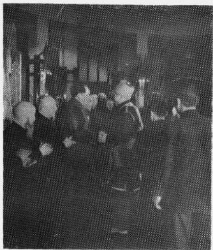
毛主席和李济深副委员长等会见台籍高山族代表。