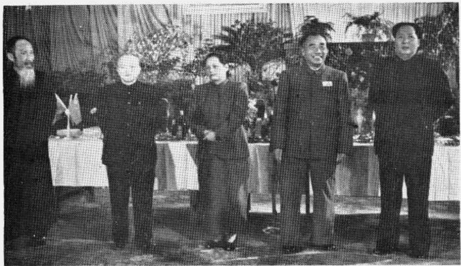
毛主席和宋庆龄、李济深等在一起。