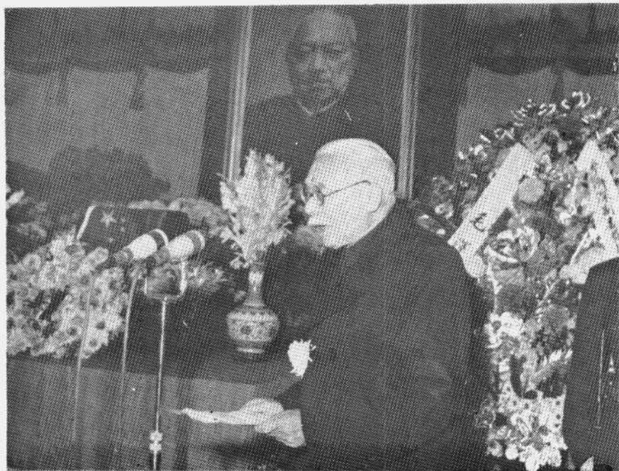
林伯渠同志在公祭李济深大会上致悼词