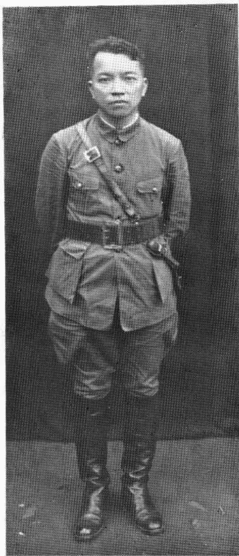
一九二七年北伐时期的李济深