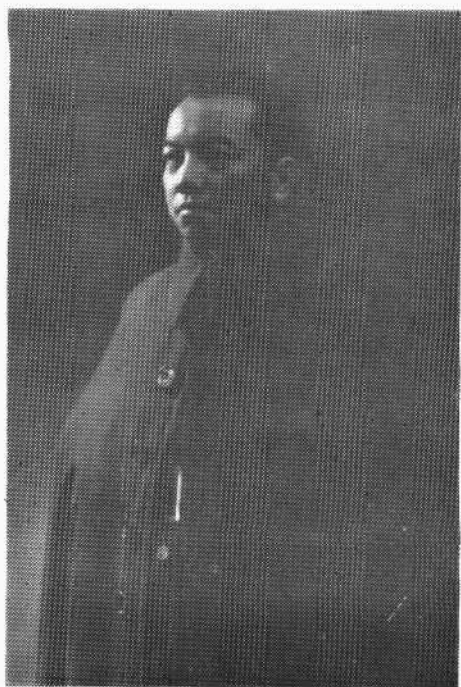
一九四〇年李济深在重庆