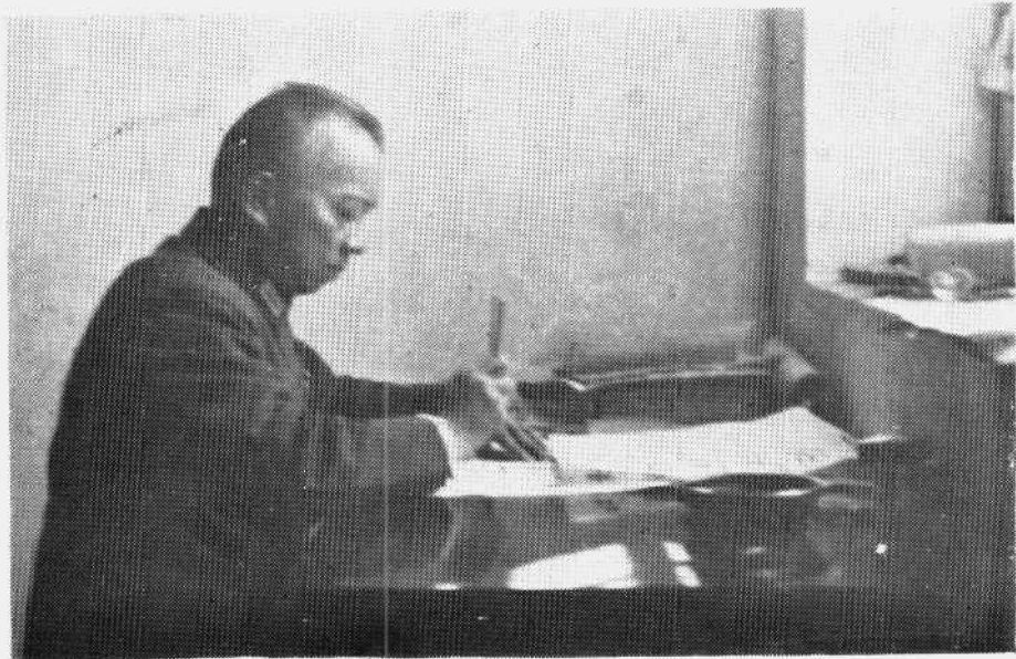
一九四一年在桂林任军事委员会办公厅主任时的李济深