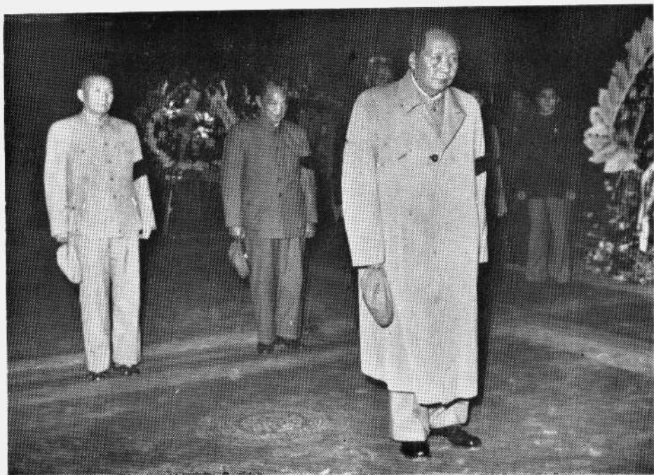
一九五九年十月九日李济深副委员长逝世，毛泽东主席前往灵堂吊唁。