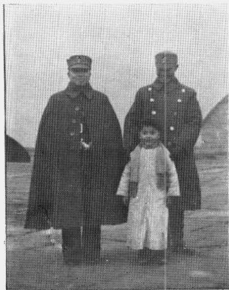
一九四〇年李济深赴渝任战地党政委员会副主任，图为在机场与陈诚（右）合影。

治道之要在知人君德之要在體仁御下 之要在推誠用人之要在擇言理財之要 在經制足用之要在薄斂除寇之要在安 民 李濟深