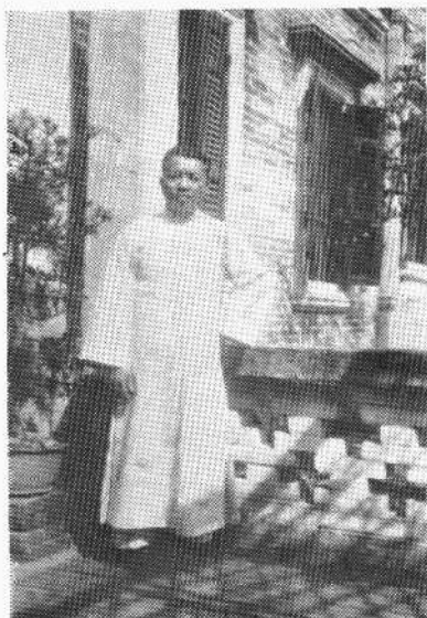
李济深在闽变失败以后，积极筹组中华民族革命同盟，图为一九三五年，他在苍梧料神村宅中留影。