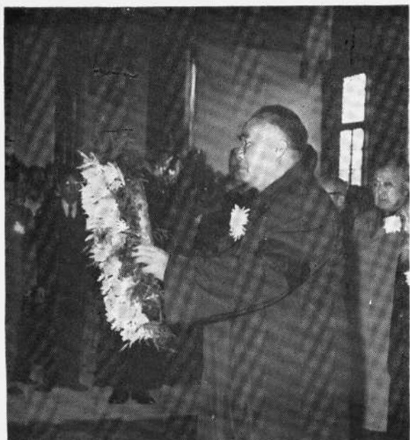
首都各界公祭李济深副委员长，公祭大会由朱德委员长主祭。