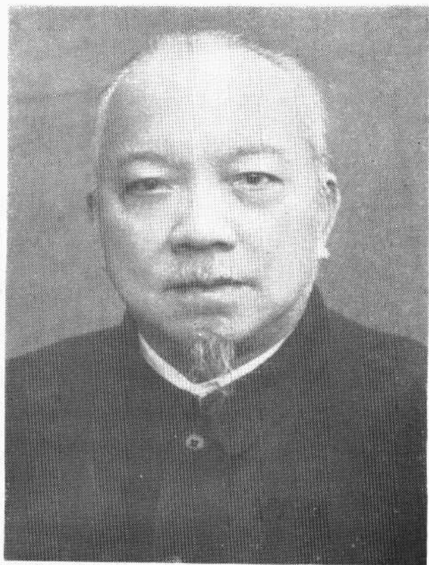
李 濟 深 像