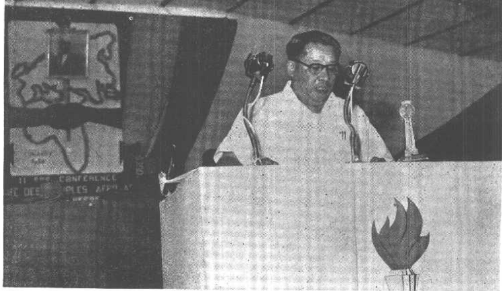
中国代表团团长廖承志在大会上发言