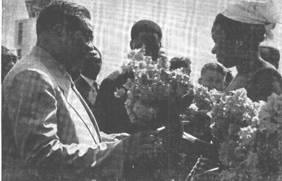
科納克里市民向中国代表团献花