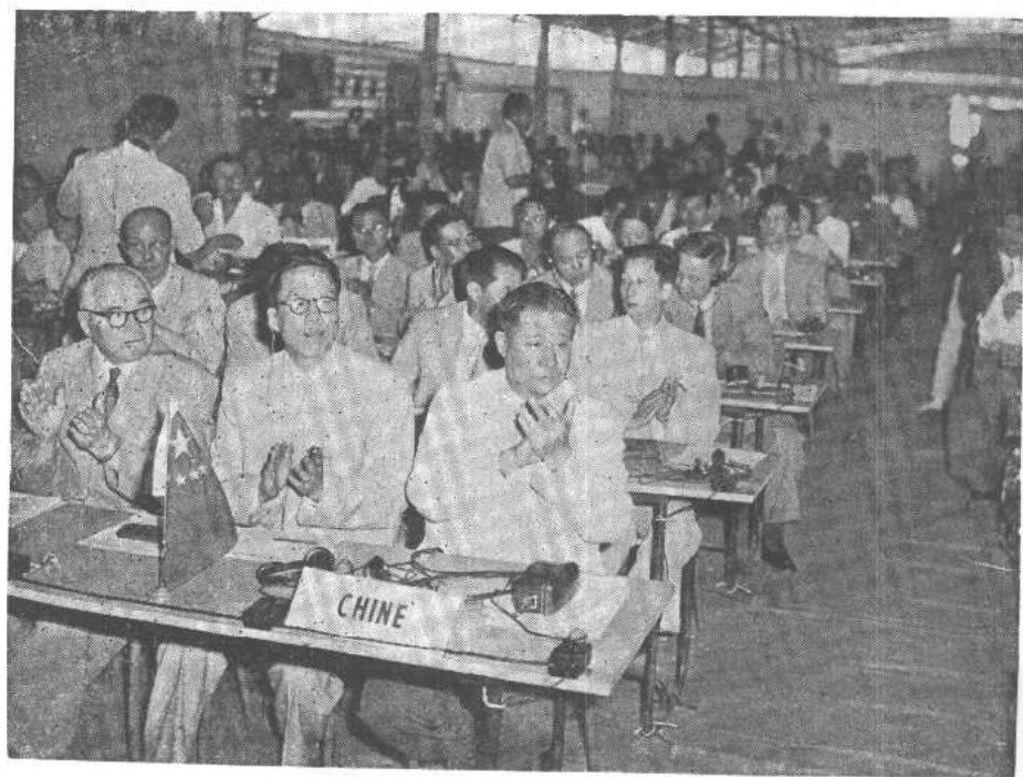
参加大会的中国代表团