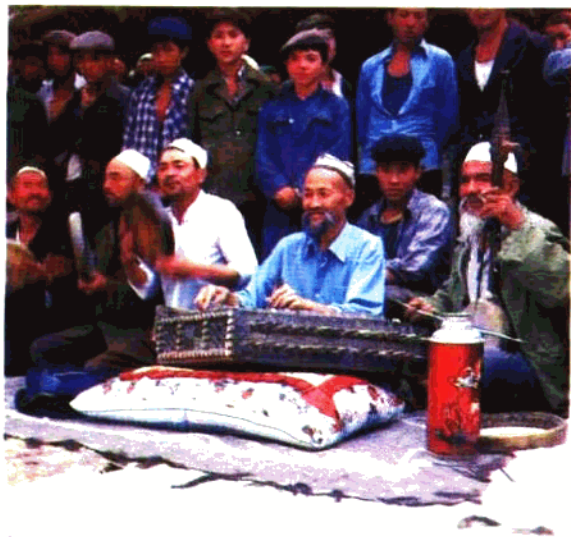
麦盖提刀郎舞乐队