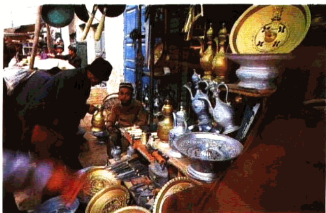
巴扎小工艺品市场