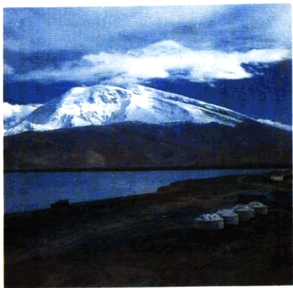
冰山之父——慕士塔格峰