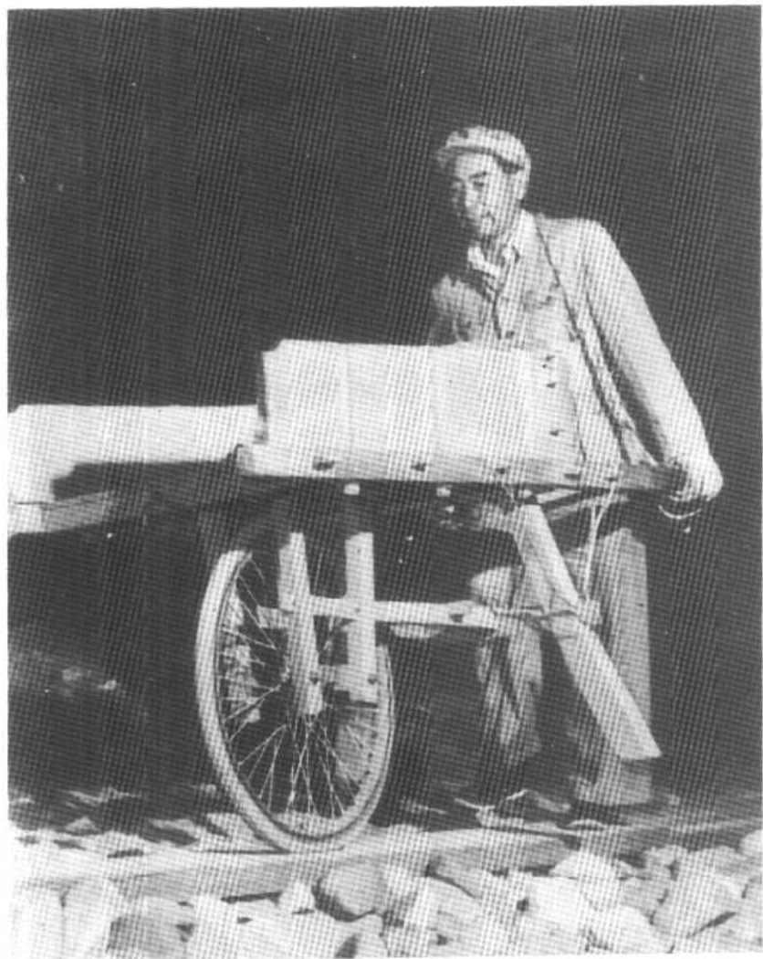
1958年6月，周恩来在十三陵水库工地参加劳动。