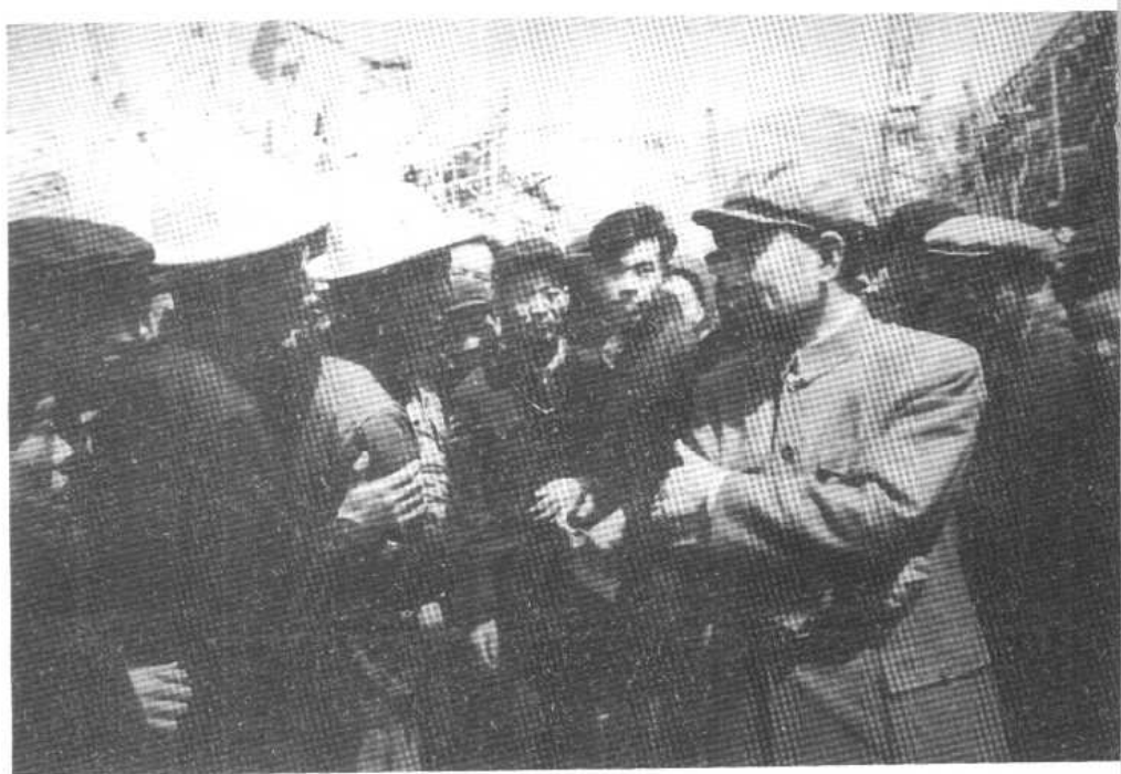
1958年4月20日，周恩来在黄河三门峡工地同水利建设者交谈。