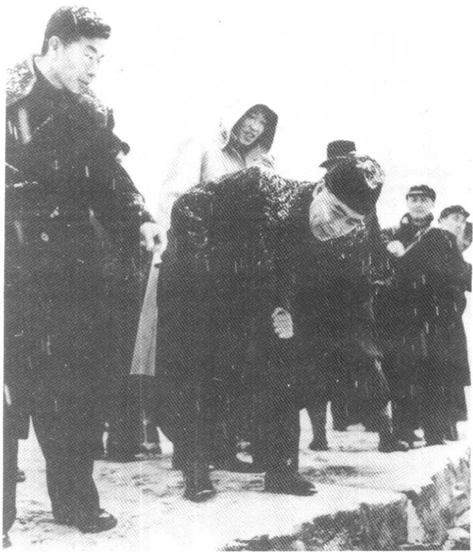
1958年2月底至3月初，周恩来偕同李富春、李先念，并带领国务院和有关省的同志，乘江峡轮从武汉逆江而上，察勘了三峡坝址。图为途中冒雪视察荆江大堤。