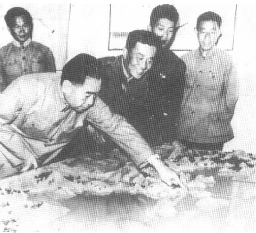
1959年5月， 周恩来观看密 云水库模型。