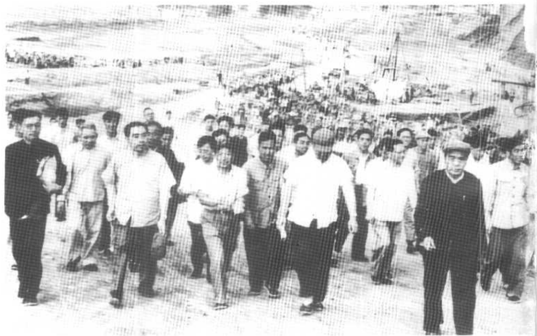
1959年6月，周恩来视察河北省黄壁庄水库。