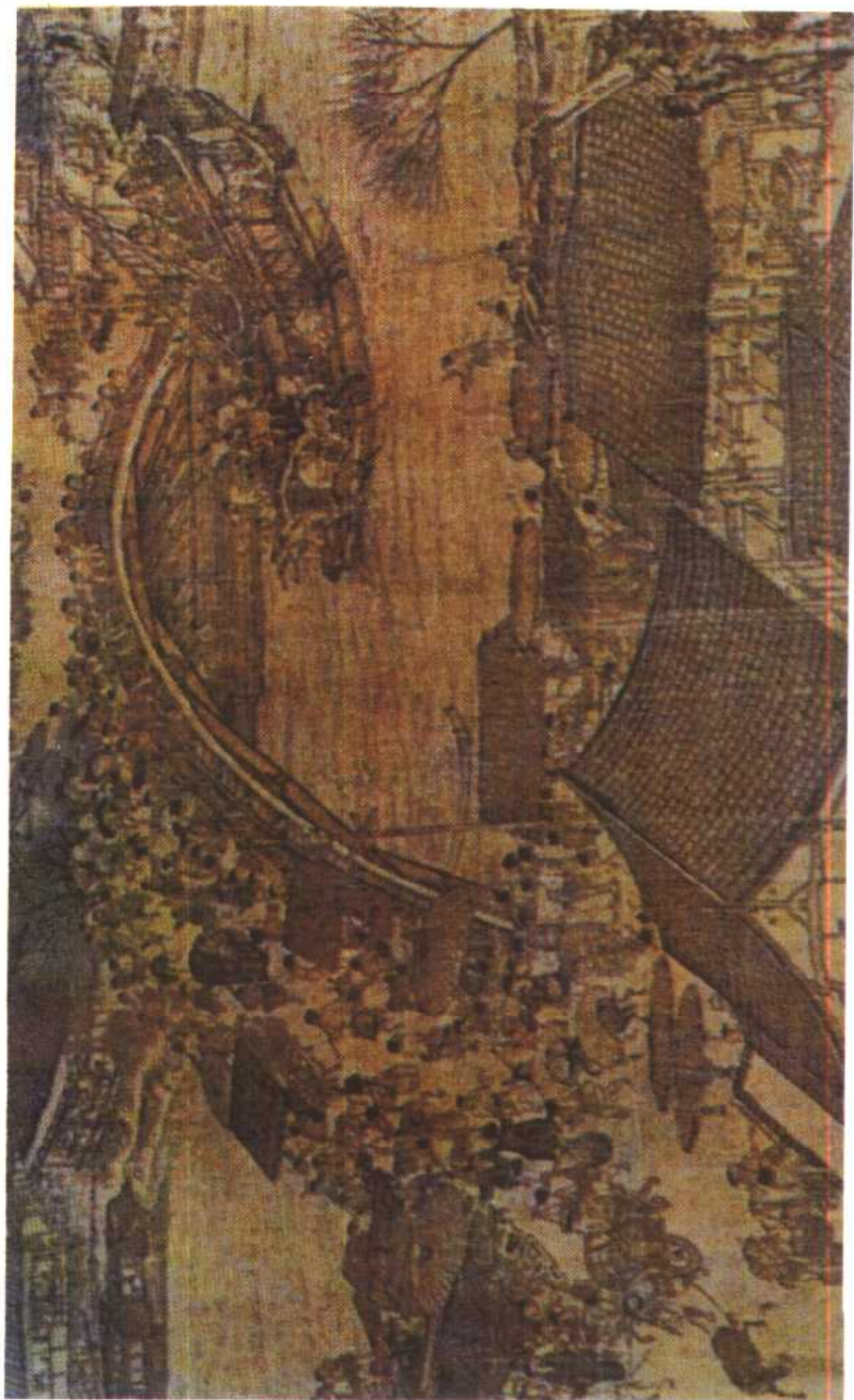
宋张择端绘清明上河图（局部）