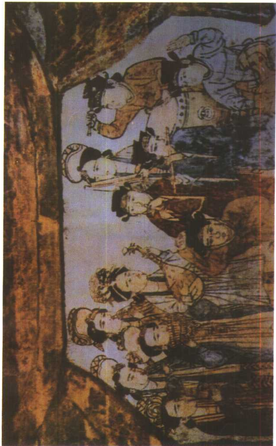
河南禹县宋墓壁画乐舞图