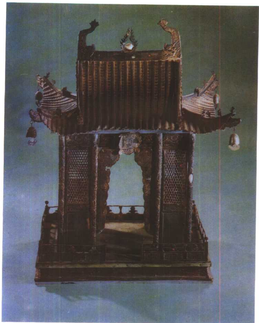
浙江宁波出土宋银制地宫