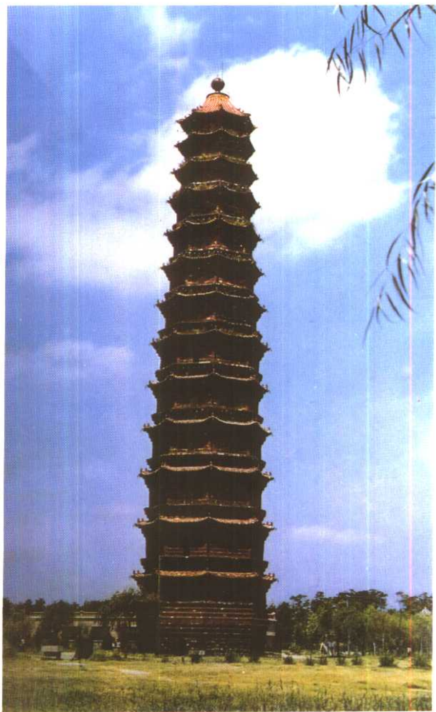
河南开封宋开宝寺铁色琉璃塔