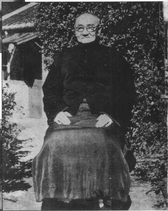
阎锡山在菁山草庐的最后留影