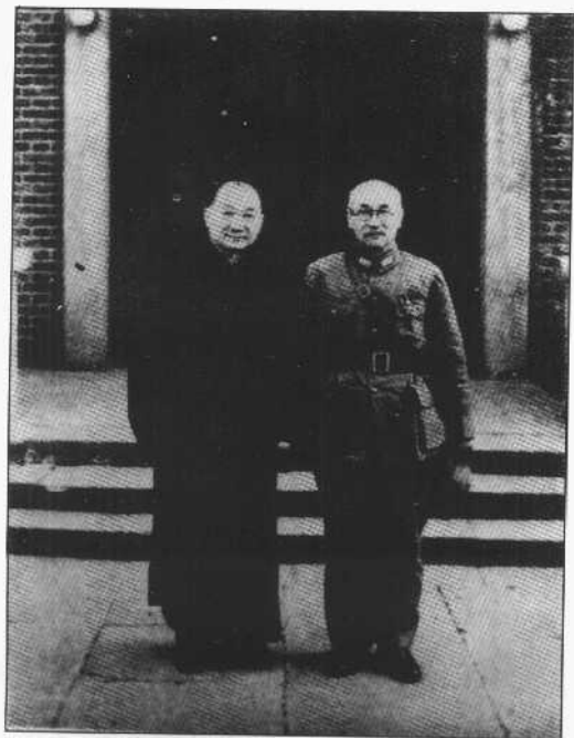
抗战胜利阎锡山与孔祥熙在重庆合影