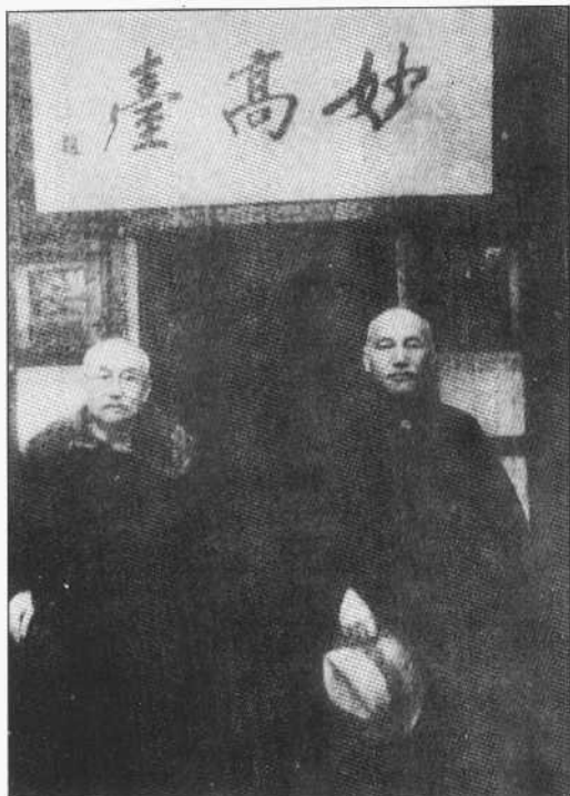
1949年4月11日阎 锡山在溪口妙高台与蒋介石合影