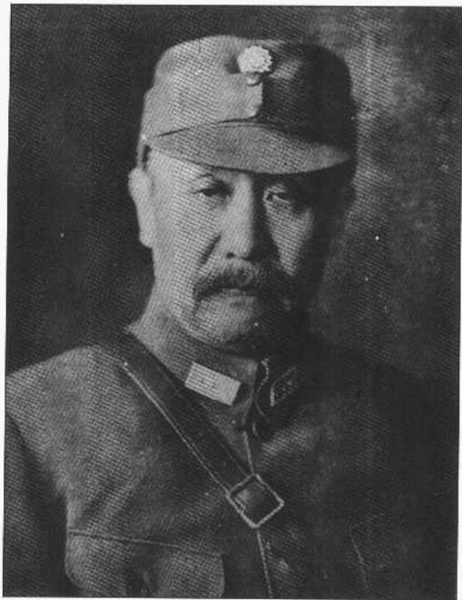
1939年阎锡山主持第二战区军政高级干部会议时的留影