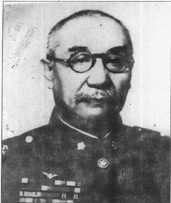
1950年8月20日阎锡山移居台北菁山草庐