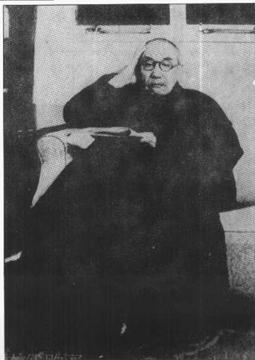
1949年4月22日阎 锡山闲居于南京时的留影