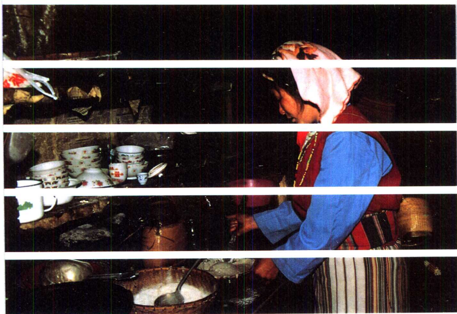
17 丙中洛阿龙村寨的 家庭主妇—— 在成功男人的 背后