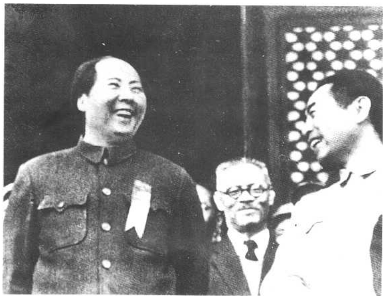
1949年10月1日，和毛泽东在天安门城楼上（中间为张奚若）。