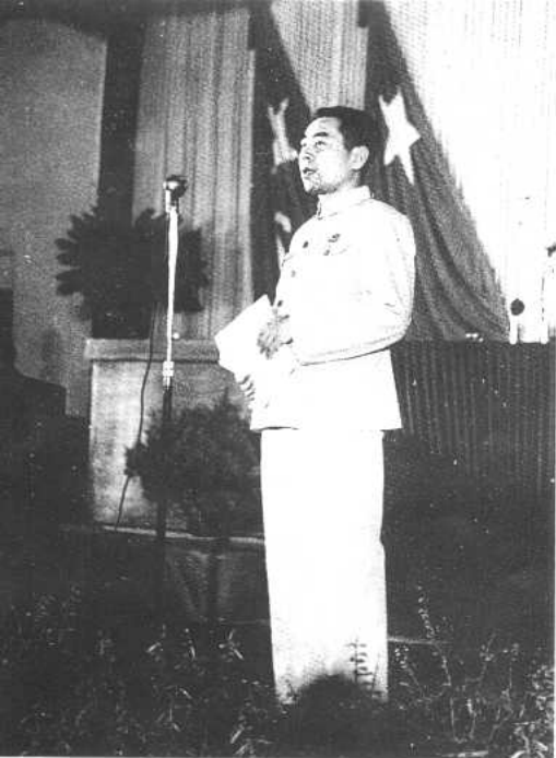
1949年9月21日，在中国人民政治协商会议第一届全体会议上，代表筹备会作报告，会上，当选为大会主席团成员。