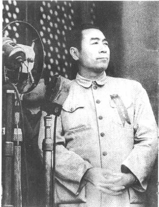
1949年10月1日，中华人民共和国开国大典，在天安门城楼上。