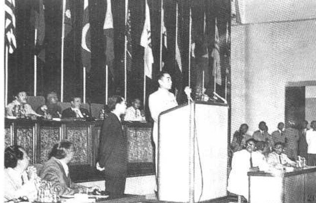
1955年4月， 在印度尼西亚万隆 召开的亚非会议上， 发表重要讲话。