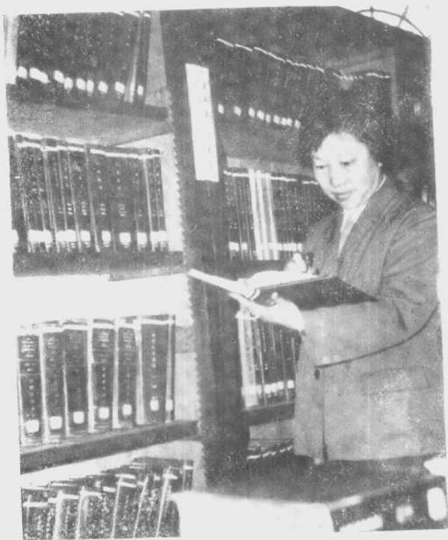
作者在图书馆查阅文献。