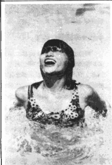
105—SS F8 1/125秒 135—SS F8 1/250秒

示畫面的簡潔和環境的說明。其次利用低角度來強調人物的形態，或以藍天白雲為背景來簡潔畫面，突出主體，也是常用的手法。尤其是利用廣角鏡來誇張人物，使其產生婷婷玉立的效果時，更非低角度攝影莫屬。至於平攝角度，以使用長鏡頭來拍半身人像，最為常用。不過在使用上，應注意水平線的畫面配置和光影效果。只要您在拍攝時，能從觀景窗中多注意角度的效果，相信將能選擇到最佳的攝影角度。