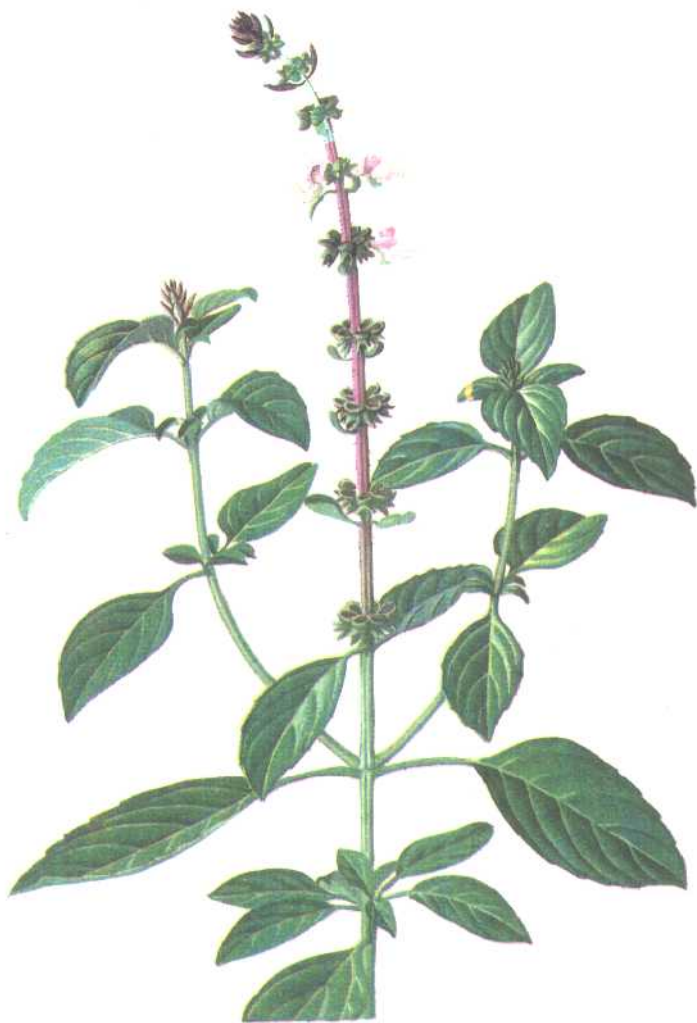
图 3 罗勒