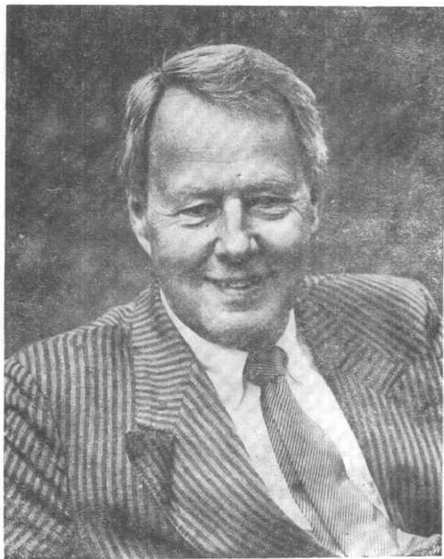
本书作者：斯蒂格·哈登纽斯