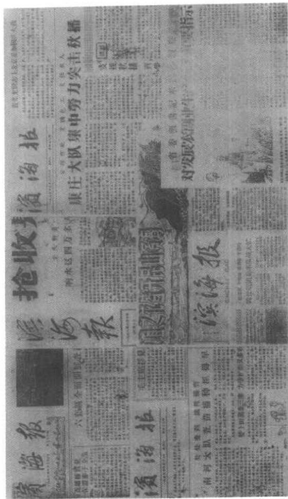
《滨海报》是以宣传党的方针政策、报道农业生产为主的通俗的农民报。