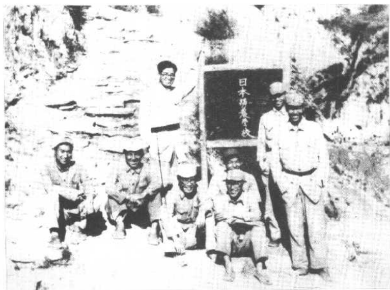
日本工农学校部分成员(一九四五年于延安)。