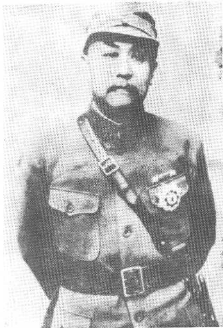
抗日战争时期任第二战区 司令长官的阎锡山