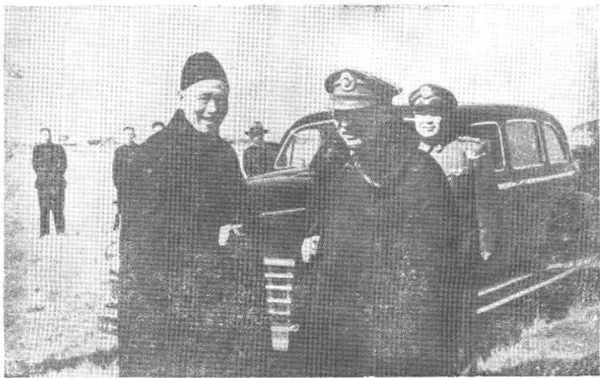
1949年2月， 阎锡山在浙江奉化 溪口会见蒋介石