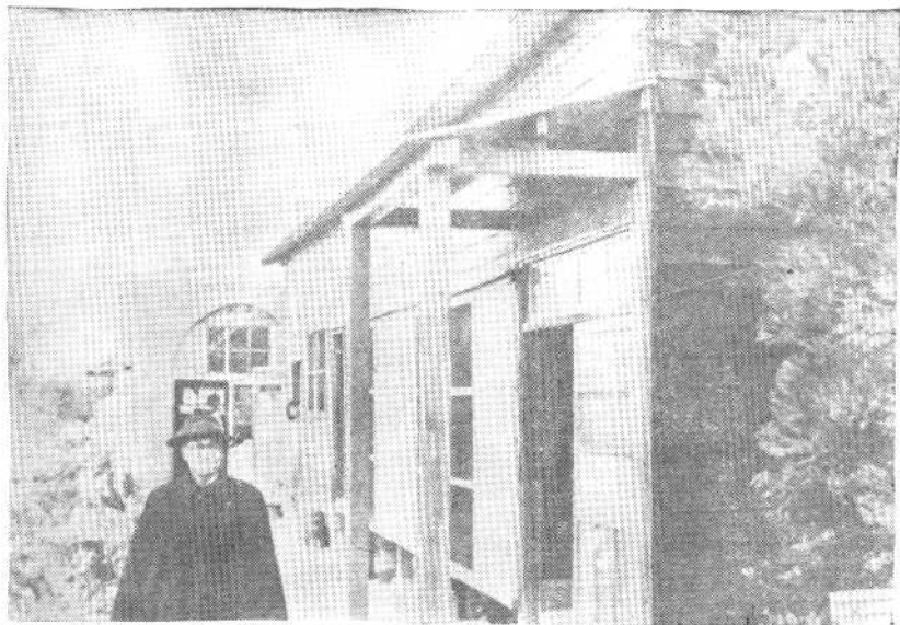
1950年6月28日， 阎锡山在台北菁山寓所