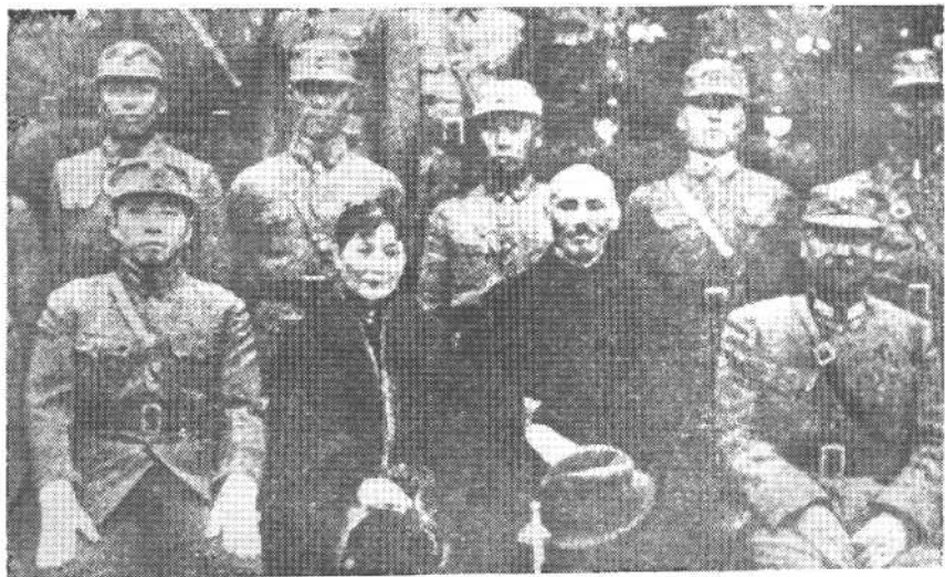
1936年10月31日，在洛阳阎锡山与蒋介石等合影。前排左起： 张学良、宋美龄、蒋介石、阎锡山