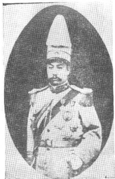
任山西督军时的阎锡山