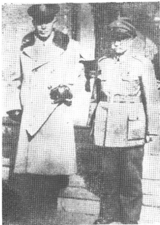
1946年8月， 阎锡山与美国特使 马歇尔在太原合影