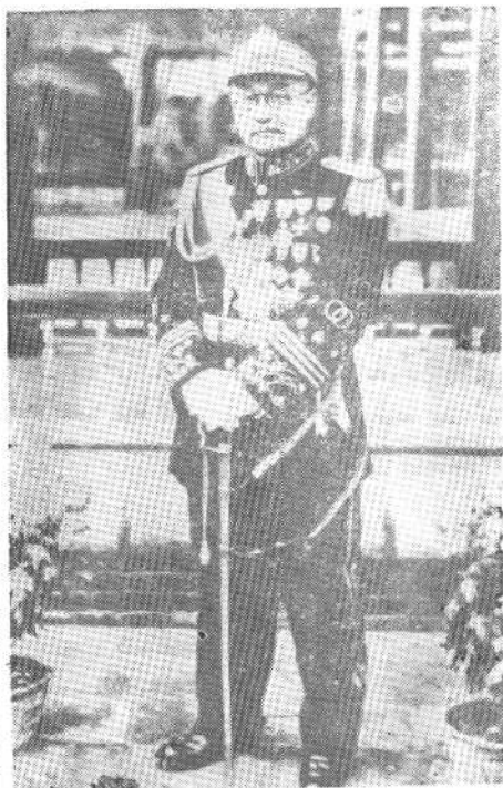
1945年抗战胜利后， 阎锡山回太原着礼服留影