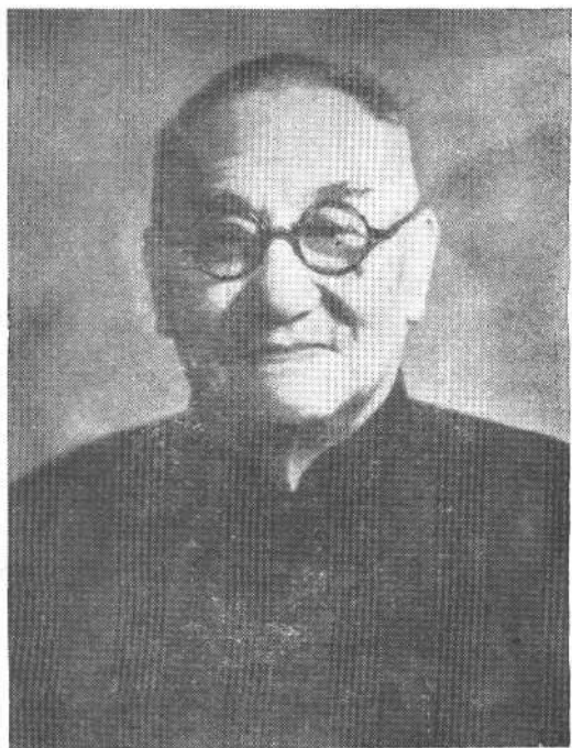
阎 锡 山 遗 像