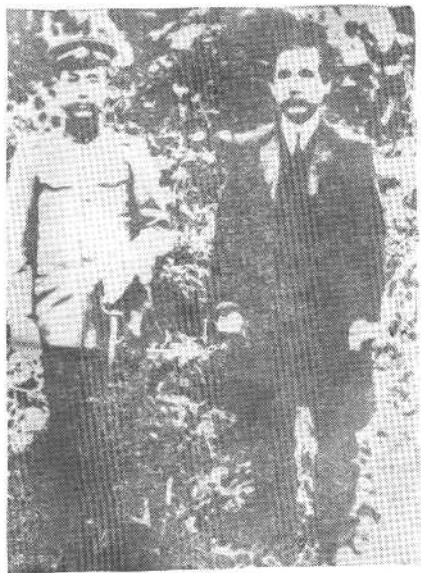
1912年9月，阎锡山与孙中山在太原合影