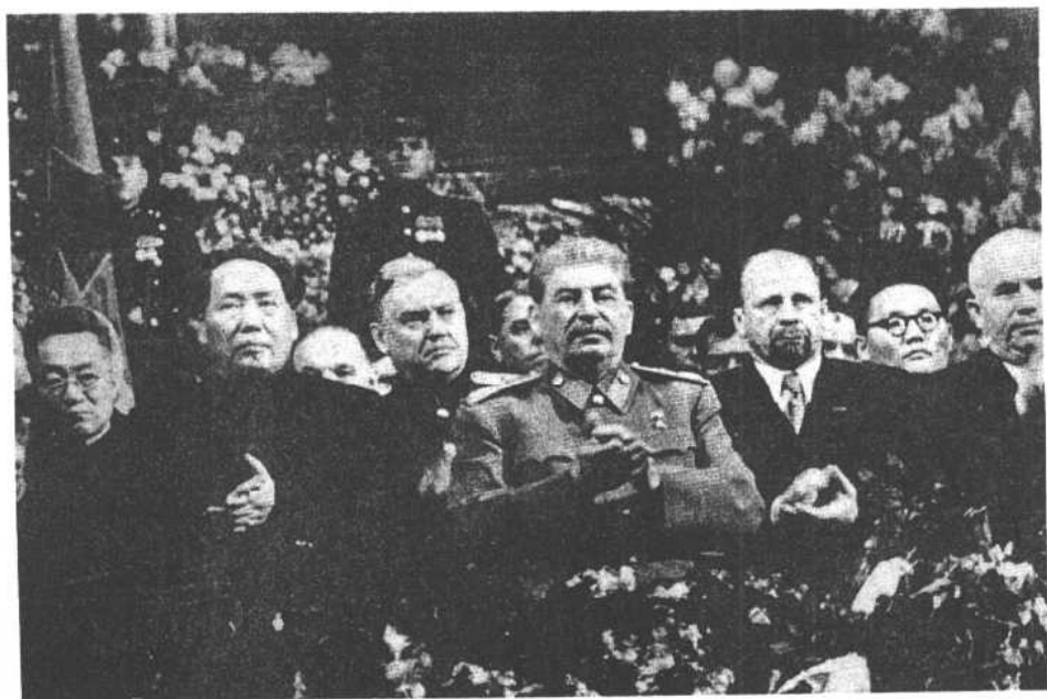
1949年12月21日，在莫斯科庆祝斯大林七十周年诞辰大会上。左起：师哲、毛泽东、布尔加宁、斯大林、乌布利希、泽登巴尔、赫鲁晓夫。