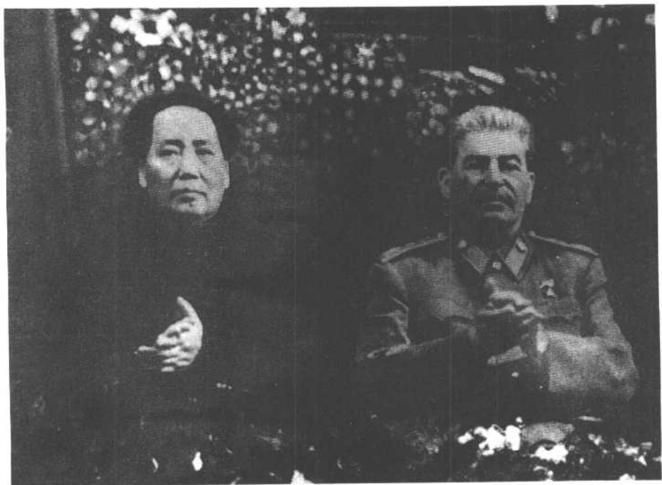
1949年12月16日，毛泽东赴苏联访问抵达莫斯科。图为毛泽东、斯大林在庆祝斯大林七十寿辰的招待会上。