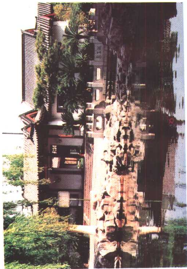
李清照纪念堂(山东济南)