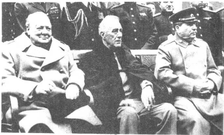
1945年2月，三巨头在克里米亚举行雅尔塔会议。前排左起：丘吉尔、罗斯福、斯大林。