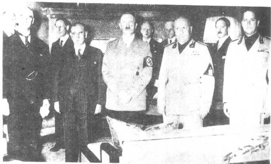
希特勒与墨索里尼(左三、四)，在慕尼黑与英国首相张伯伦(左)及法国总理达拉第举行会议。