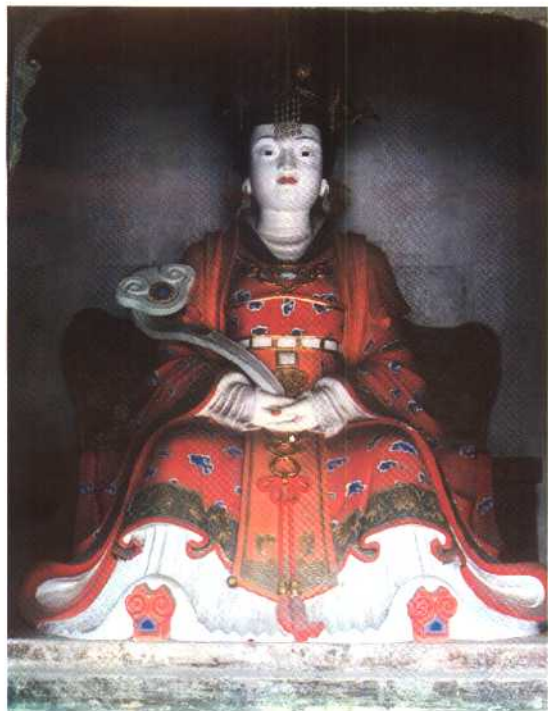
文水则天庙正 殿武则天彩塑