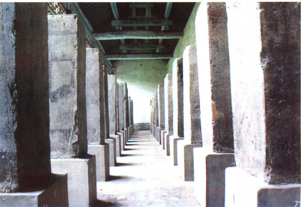
山西太原风洞石经