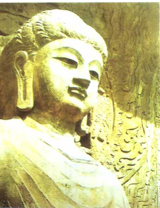
洛阳龙门石窟大卢舍那佛像