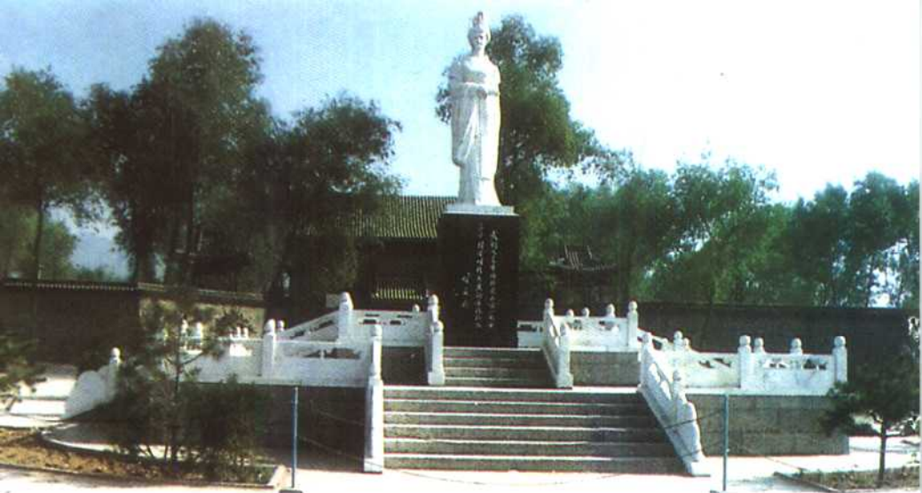
山西文水则天庙武则天塑像 (山西文水县博物馆 梁恒唐摄)