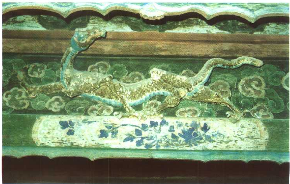
文水则天庙塑像龕顶木质浮雕