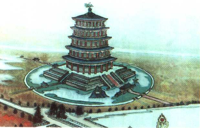
天堂复原图