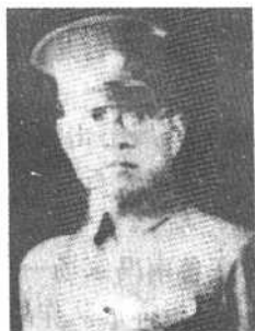
第51军114师师长 方叔洪中将