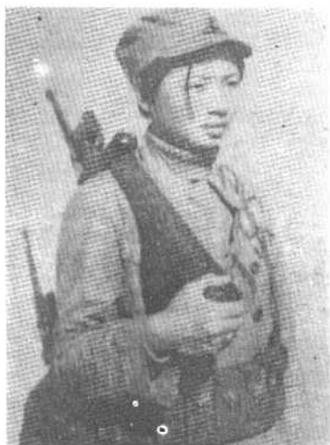
女游击队员的英姿