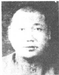
东北游击队总司令 唐聚五中将