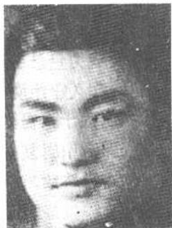
苏鲁战区政治部主任 周复中将