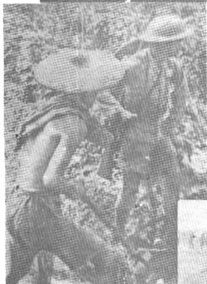
敌后实行兵农结合