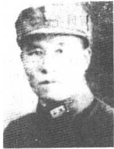
第五战区第2路游击司令 刘震东中将