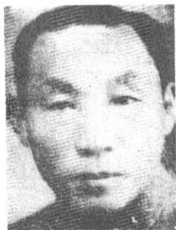
第3军军长唐淮源上将