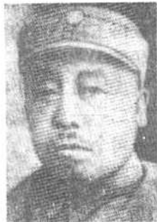
第98军军长 武士敏将军