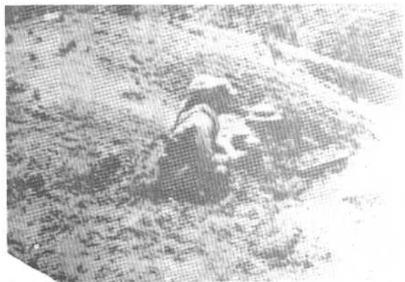
严陈以待的大别山 游击军阵地