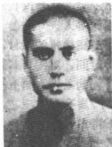
东北挺进军骑兵第6师师长 刘桂五中将