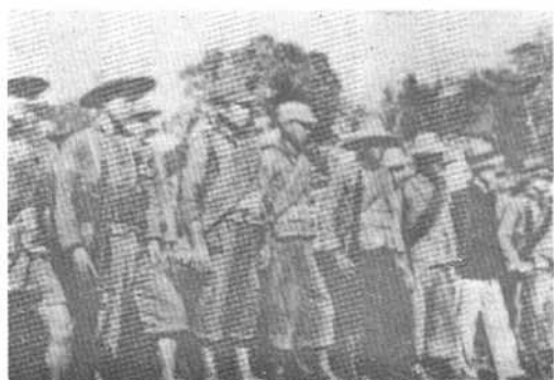
整装待发的游击部队