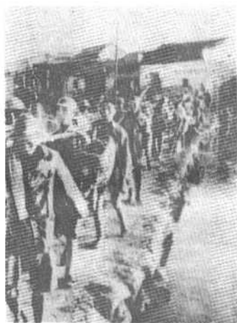
转战于河湖港叉的游击军