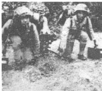
身着伪装服的游击军出击敌人