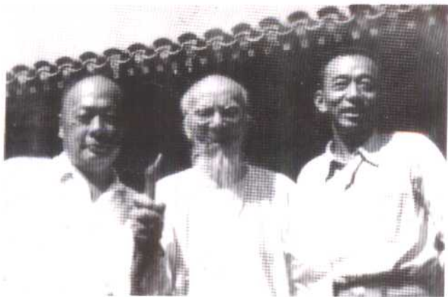
1952年，与 陈毅看望齐白石