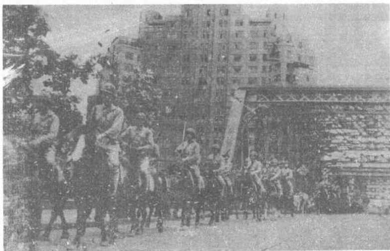
人民解放军骑兵部队进入上海市区。