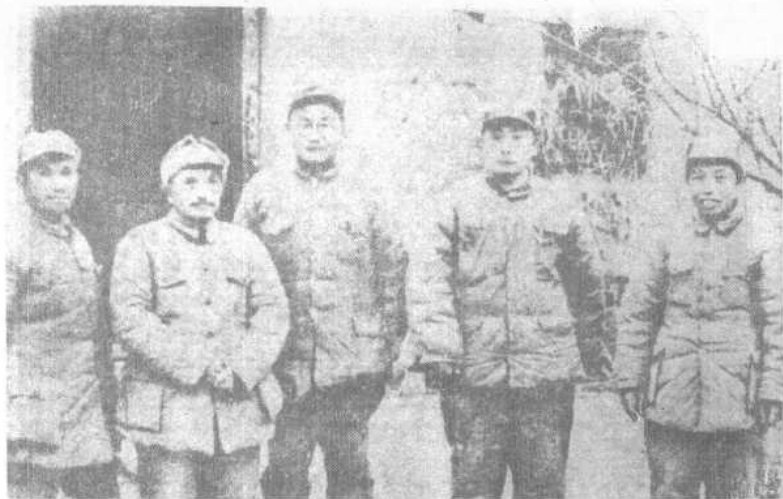
渡江战役总前委成员合影。从左至右：粟裕、邓小平、刘伯承、陈毅、谭震林。