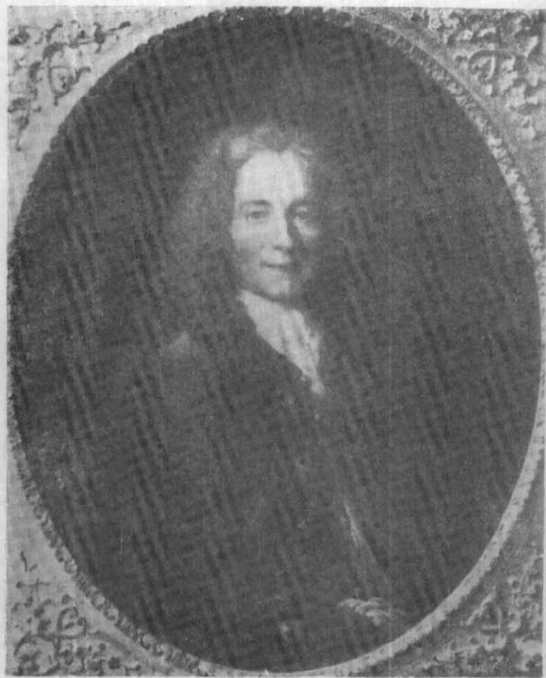
伏尔泰24岁时画像 (法国名画家拉吉利埃作)