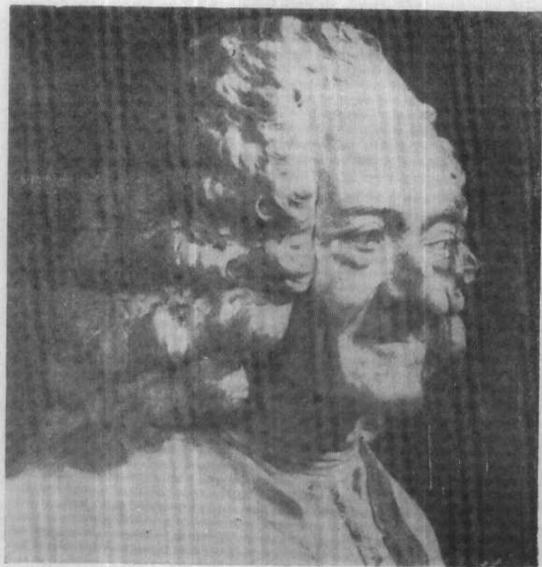
伏尔泰晚年塑像 (法国雕塑家罗歇·维奥莱作)