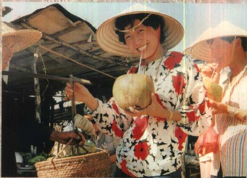
万象河边清凉甘甜的椰子水呀。