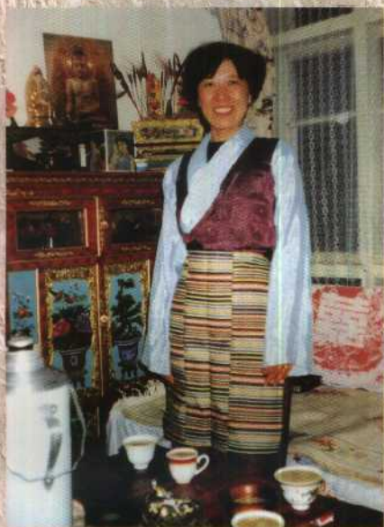
在藏胞家里穿上藏族服装，像不像个拉萨的主妇？