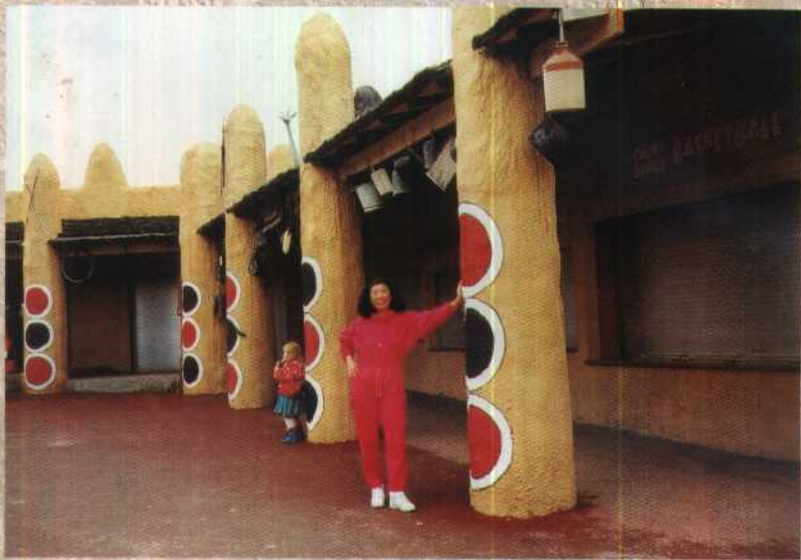
英国野生动物园的古朴情趣。