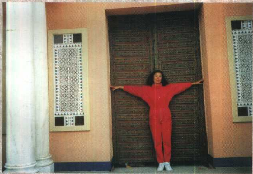
埃及风味的建筑。量量门有多宽。