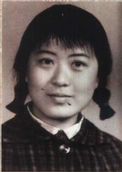
十五岁，青春好年华。