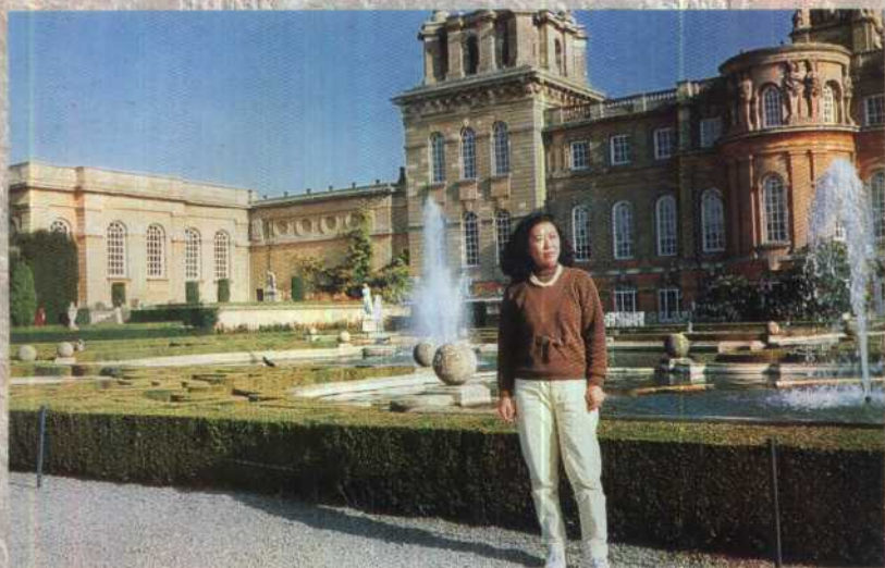
邱吉尔庄园风景如画。