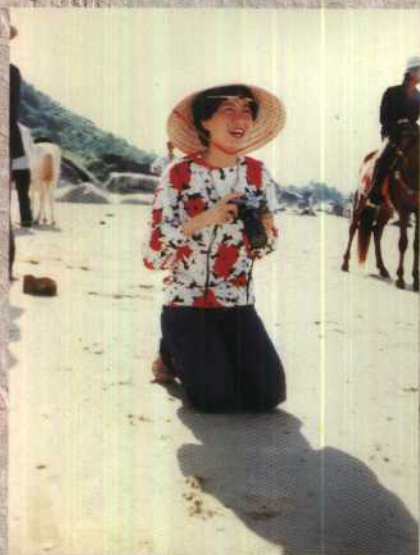
在“天涯海角”留个影。