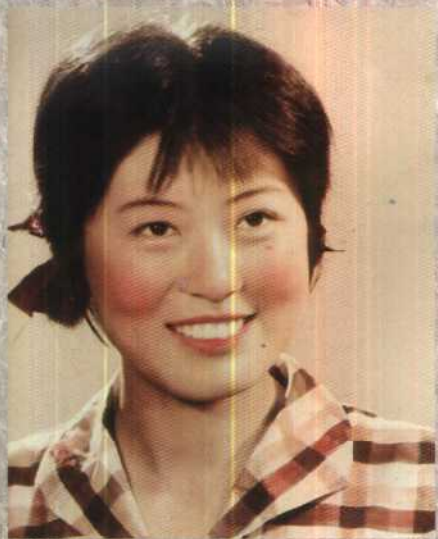
二十岁，第一次当编辑，笑得多开心！