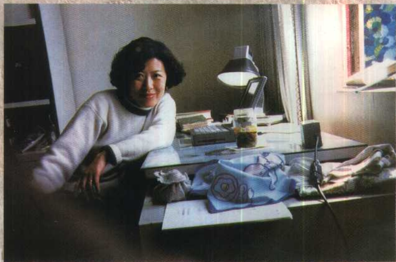
乌枪换炮，用上了电脑，感觉真不错。