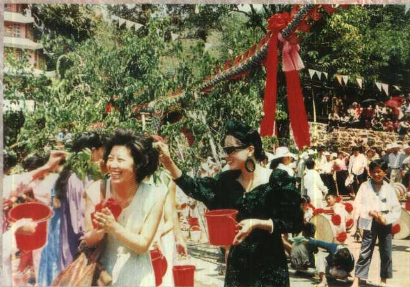
中缅边界上泼水节。大家吉祥如意！