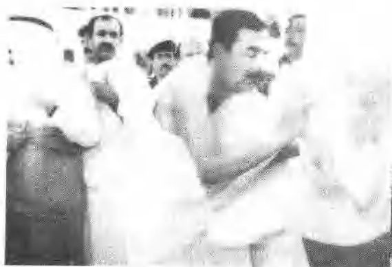
一九八八年四月麦加朝圣