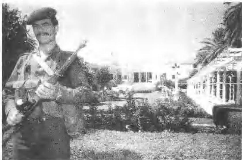
由武装士兵把守的萨达姆豪华别墅。