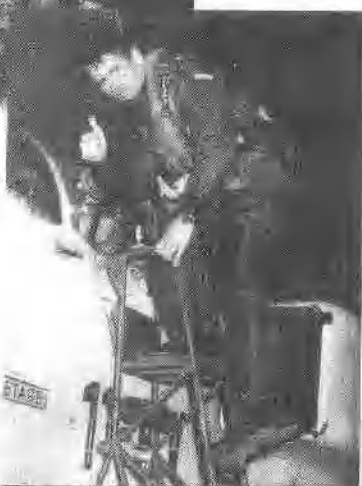
法国飞行员登上“幻影”式飞机，准备出征。