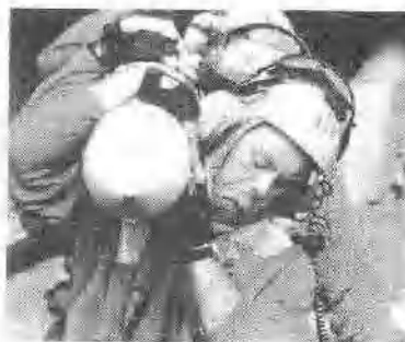
这边是伊拉克人作进总统府，发誓以肉身捍卫萨达姆；那边是美国航母尼米兹号上的士兵们进入紧张备战状态，随时准备给萨达姆送去成吨的炸弹。