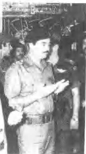
萨达姆·候赛因在信 仰上属穆斯林逊尼派。