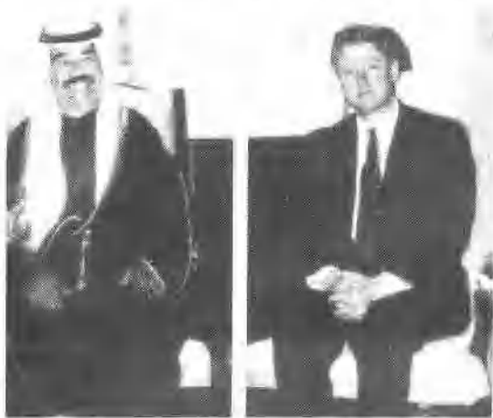
伊拉克总统萨达姆·侯赛因与美国总统比尔·克林顿