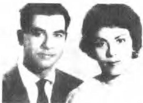
萨达姆·候赛因与其表妹萨 吉达·哈依拉拉于1962年结婚