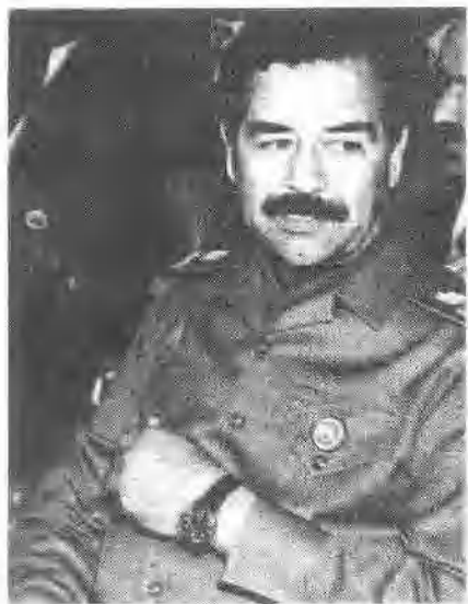
戎装的萨达姆·侯赛因。