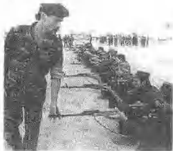
伊拉克士兵在进行射击训练。