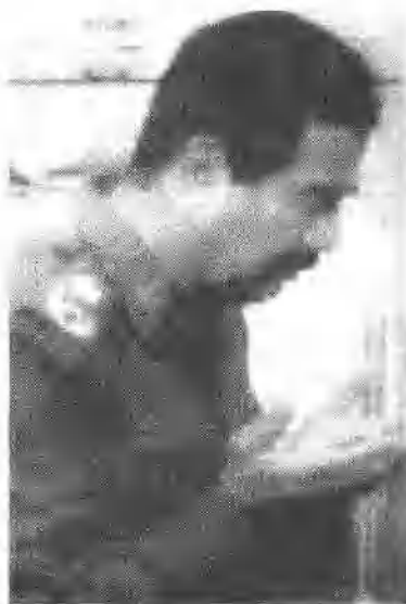
1月17日伊拉克电视节目 中出现的总统萨达姆祈祷 的镜头。