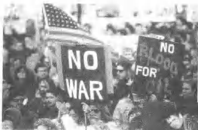
美国市民举行反战示威游行，高喊“不要战争！”“不为石油流血！”等口号。