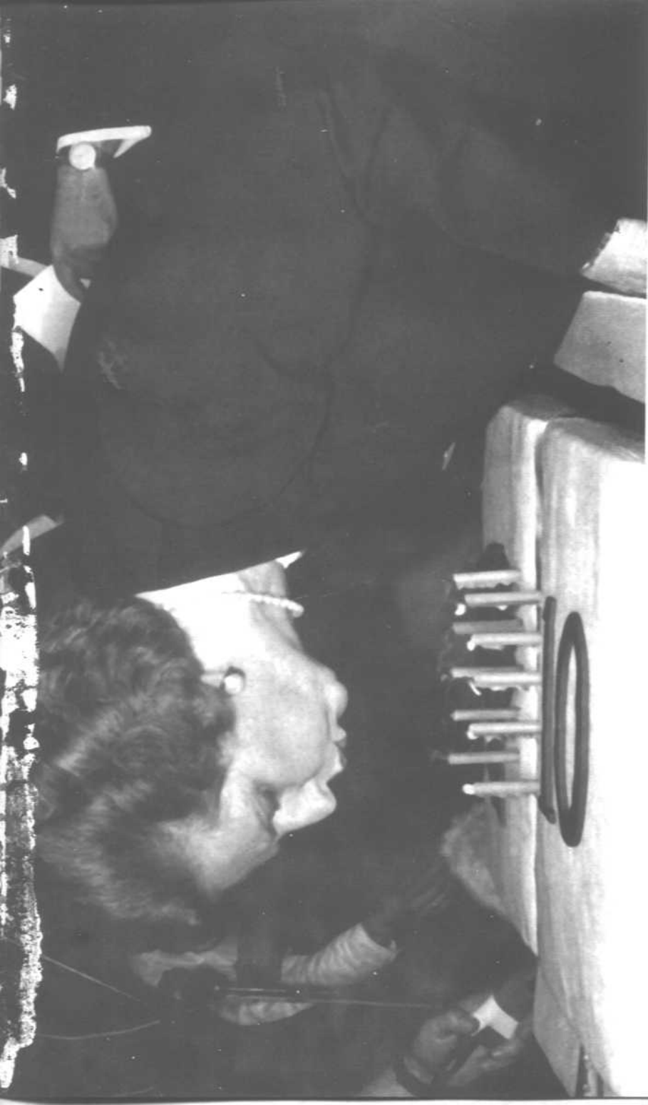
当政十年已步入谋略误区撒切尔夫人