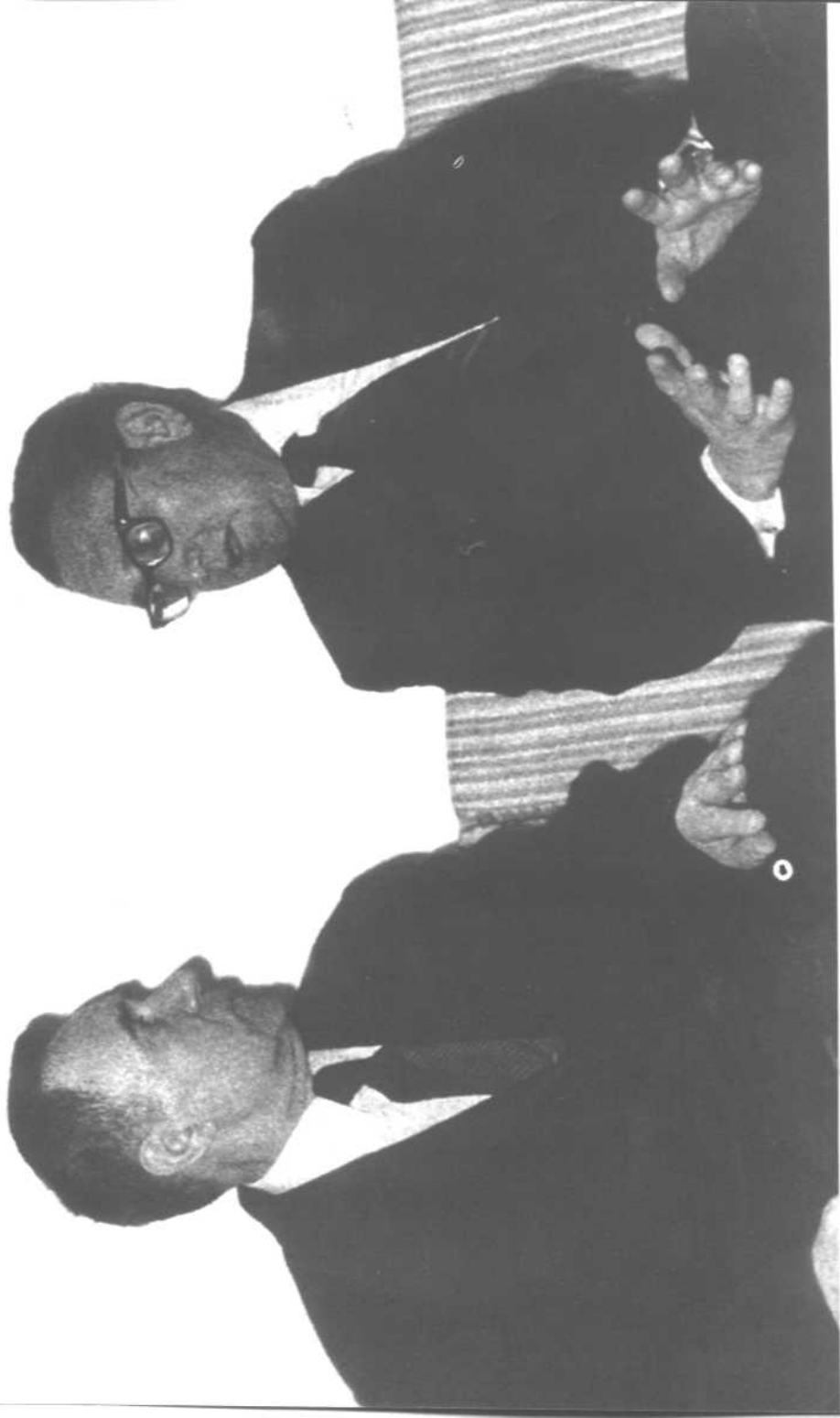
两个著名谋士间的对话——基辛格与葛罗米柯