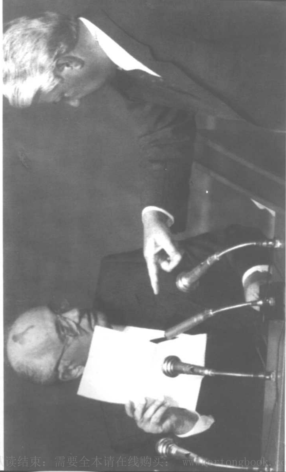
两个著名谋士间的对话——基辛格与葛罗米柯