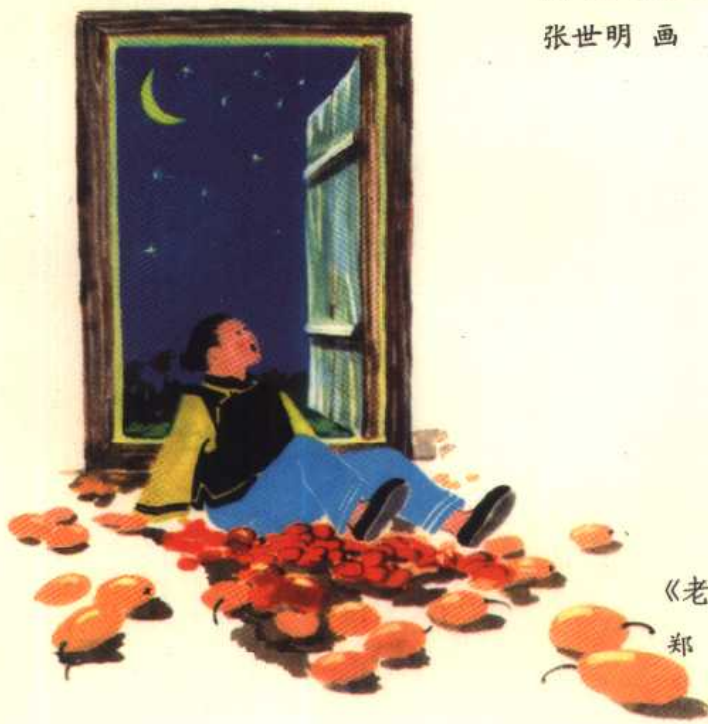
《老婆婆的枣树》 插图