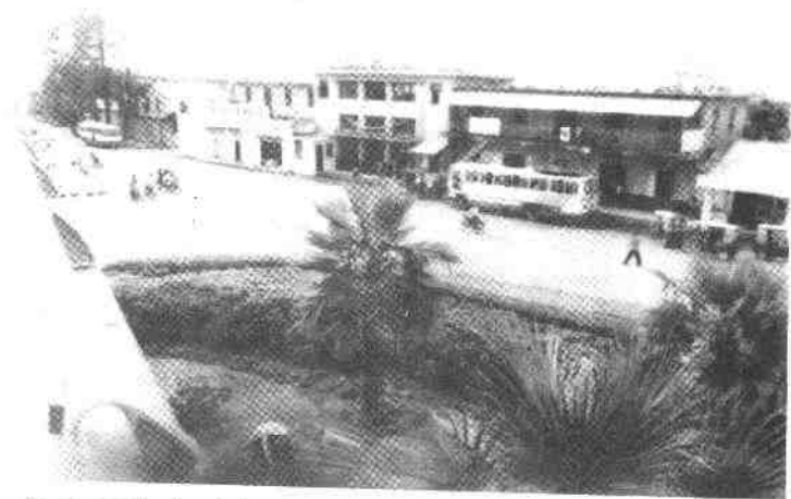
集美旧汽车站全景