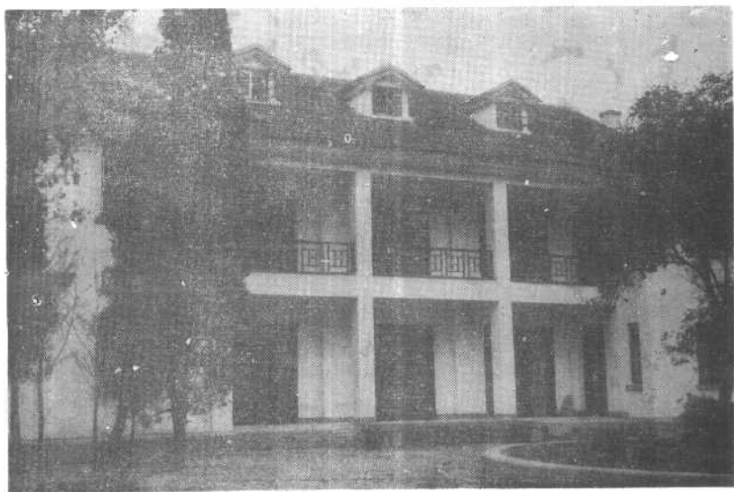
林园二号楼宋美龄住宅