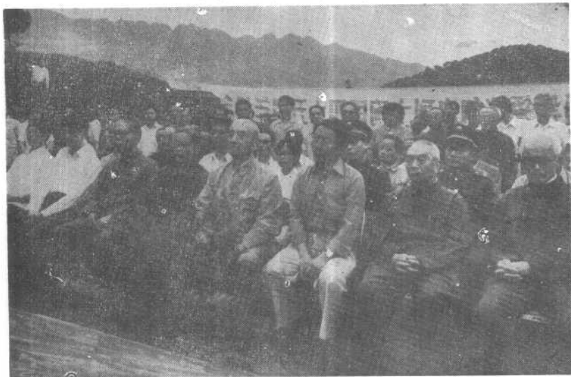
重庆党、政、军负责人和各界人士及张自忠将军亲属在纪念会上。