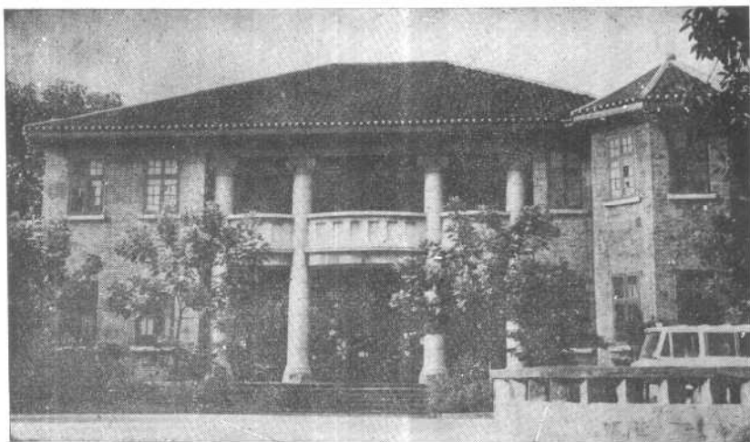
曾家岩德安里一〇一号蒋介石住宅