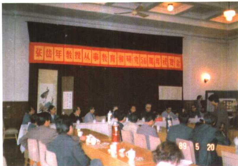
在从事教育和研究五十六周年祝贺会上