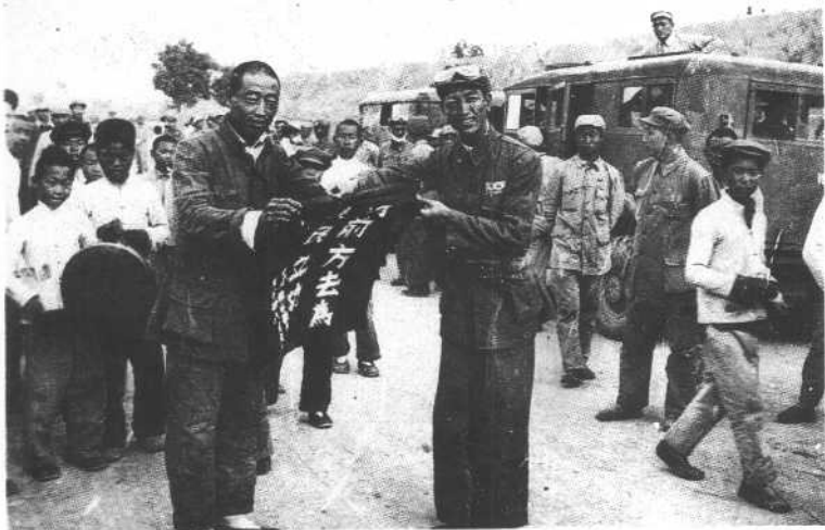
一九四九年春，耿飏在率部行军途中接受山西群众的献旗。