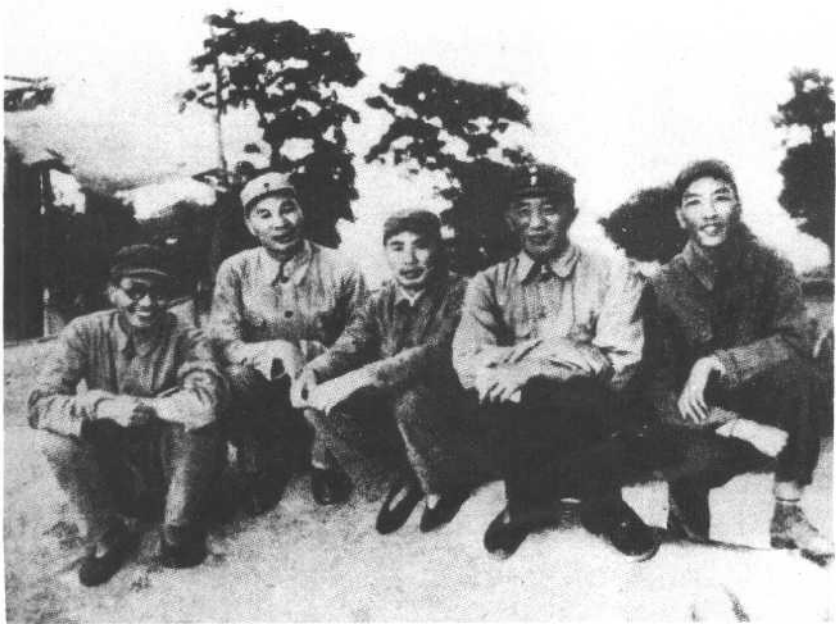
一九四七年摄于白洋淀东南一村庄。右起：耿飏、罗瑞卿、杨得志、杨成武、潘自力。