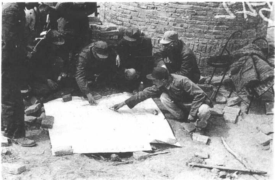
一九四九年四月太原战役中，19兵团领导干部在双塔寺指挥所。