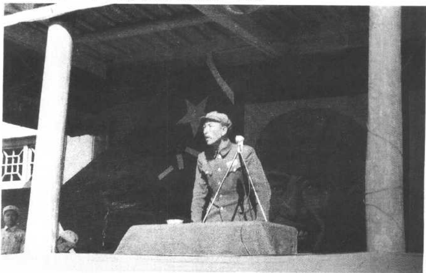
一九四八年耿飏在华北第2兵团授旗仪式上讲话。