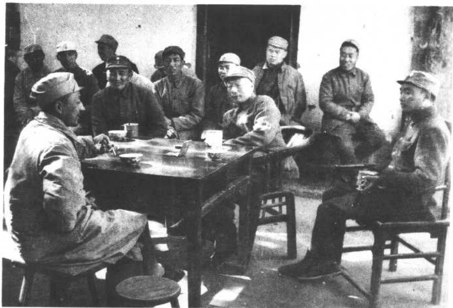
一九四七年十月二十九日，晋察冀军区和野战军领导人聂荣臻（右四）、肖克（右一）、罗瑞卿（右七）、杨得志（右五）、耿飏（右六）接见在清风店战役中被俘的国民党第3军军长罗历戎（左前第一人）。