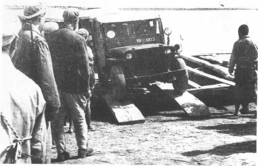
一九四九年九月，耿飏（左三）率19兵团司令部在银川南面的仁存渡口渡黄河。