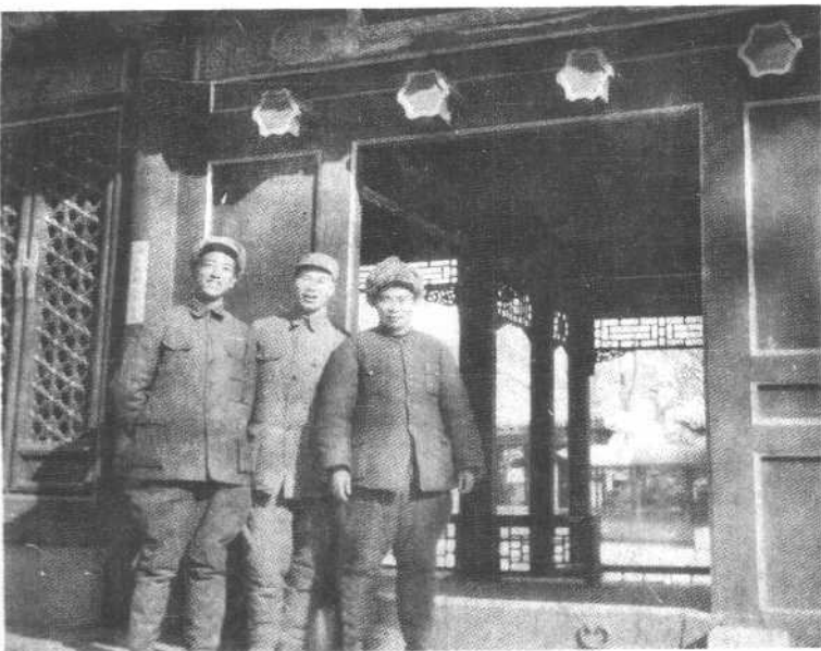
一九四九年一月平津战役中，耿飏和杨得志、杨成武合影于北平西郊。