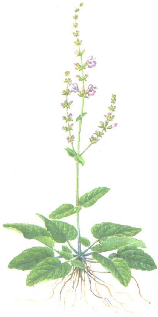
图 2 黄浦鼠尾草