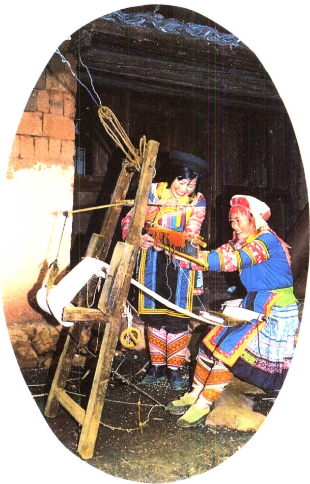
10 织布机之二 —— 腰机