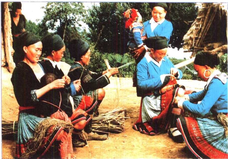
4 苗寨风情之三： 擀麻、绩麻、绣花的妇女