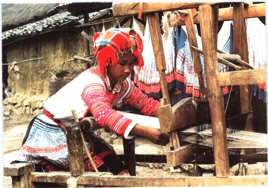
11 织布机之二——机械织机