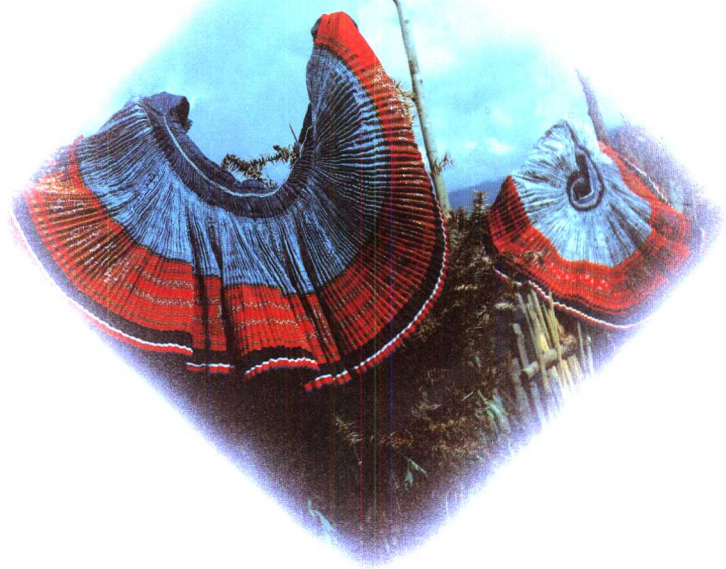
2 苗寨风情之一： 苗家蜡染百褶裙