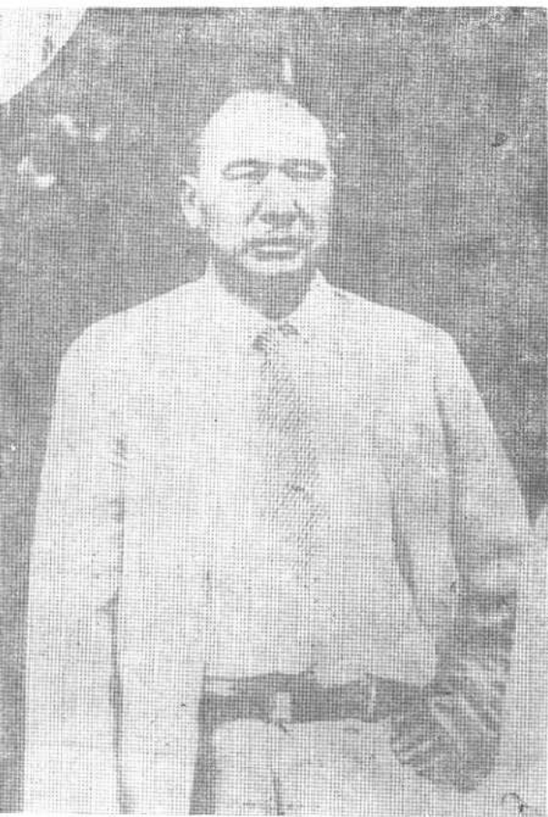
左图 被刺 前张宗昌