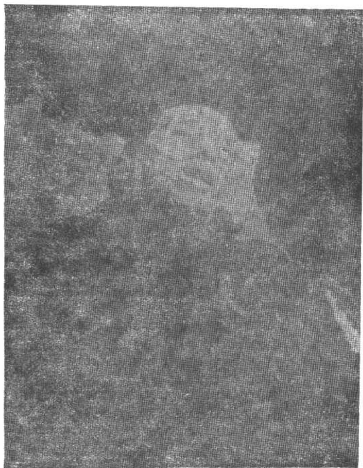
陈其美在上海萨坡赛路14号遇害