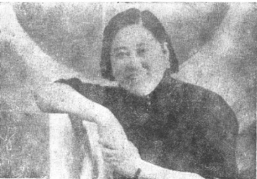
上图 施剑翘刺 杀孙传芳之 前照片