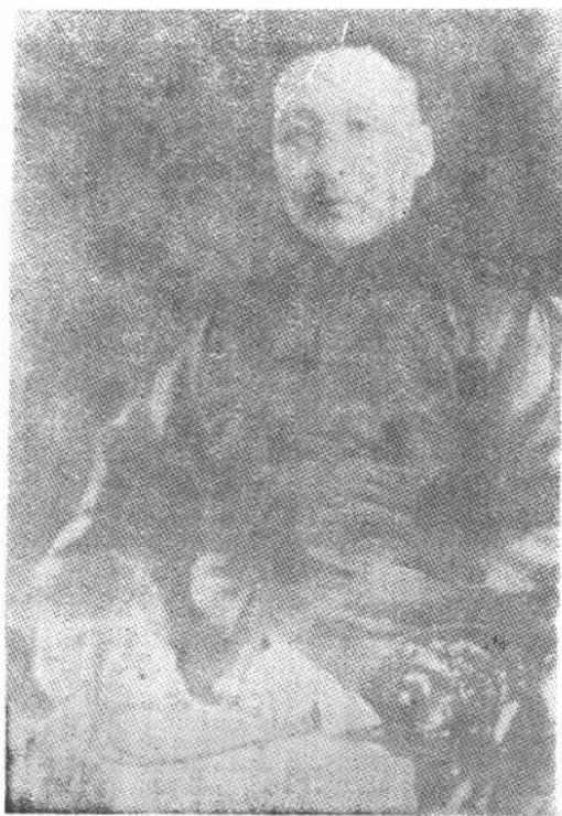
左图 孙传芳被 刺前照片