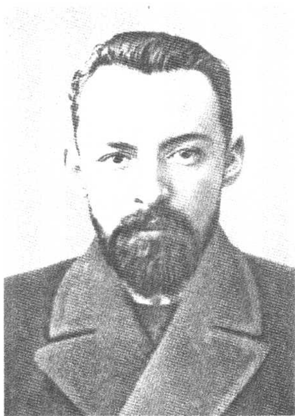
德·伊·乌里杨诺夫 1903年