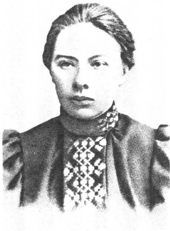
娜·康·克鲁普斯卡娅 1903年