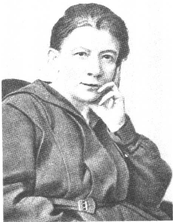
安·伊·乌里杨诺娃—叶利札罗娃 1921年