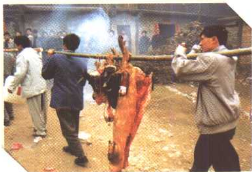
◀▲ 迎亲罗汉队