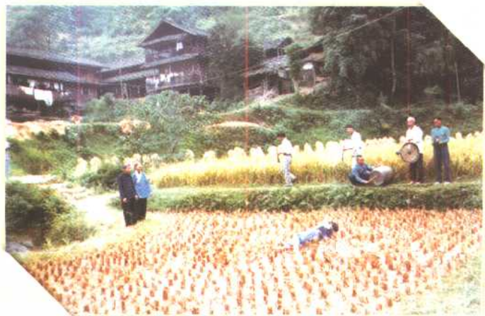
◀ 湖南新晃新隆乡 丁字坳寨杨德平 (10岁) 滚泥田