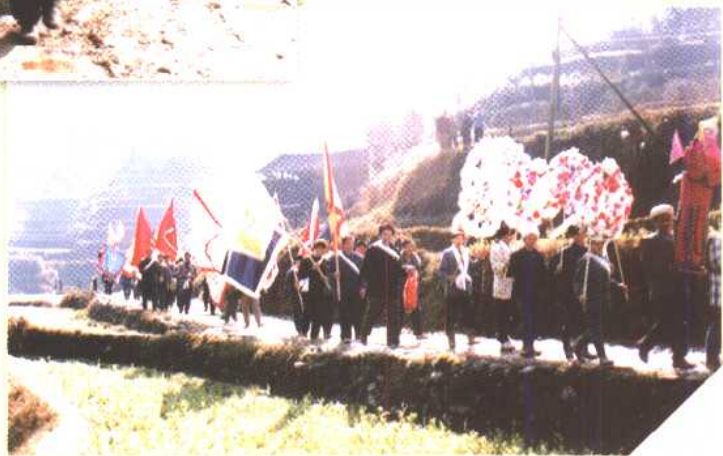
▼ 送殡队伍