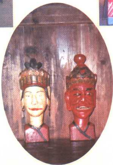
◀ 姜良、姜妹偶像 ——萨图腾 (吴文锦藏)