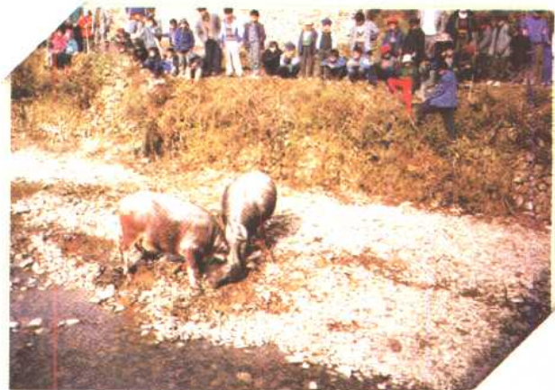
▶ 六月六尝新节斗牛