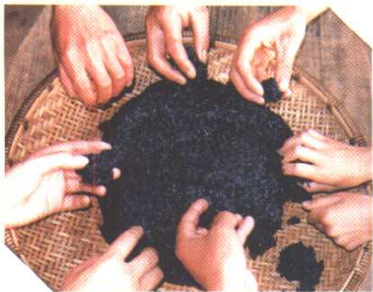
◀ 四月初八指食乌饭