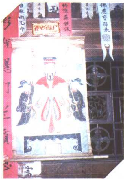
法师吴文锦所绘神像