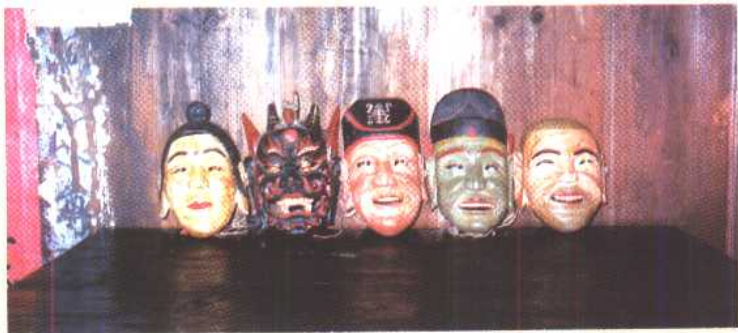
▲ 祭祀时神案上所供神像 (吴文锦藏)