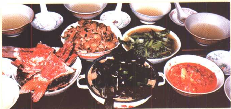
腌鱼、腌肉、腌鱼内脏和苦酒招待贵宾