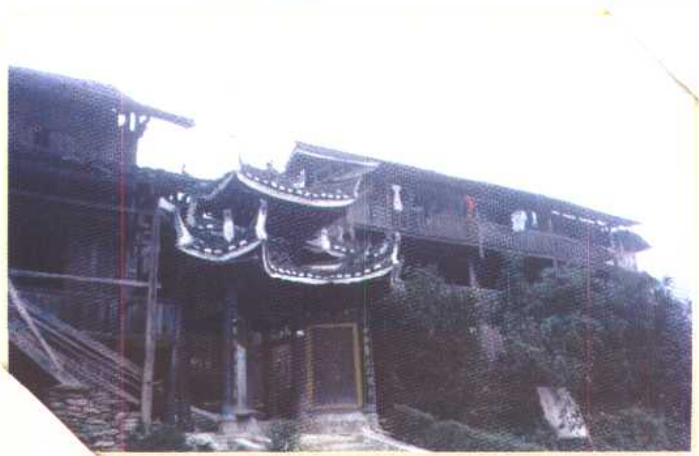
◀ 湖南通道皇都侗寨门