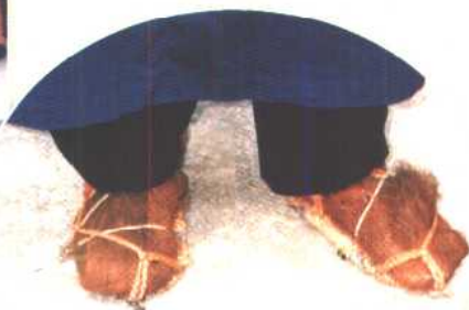
▲ 湖南新晃贡溪乡天井寨傩(祭)戏堂主脚饰