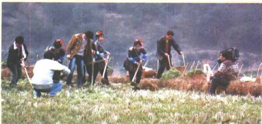
种公地“月堆华”