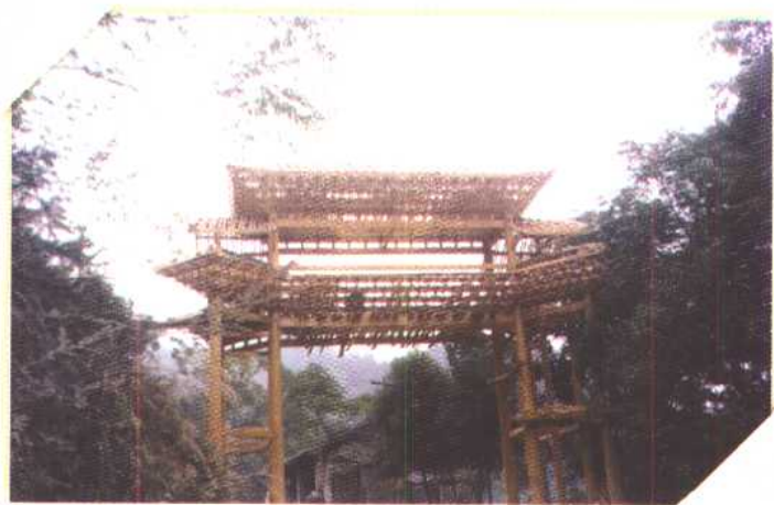
◀ 兴建中的侗寨门楼