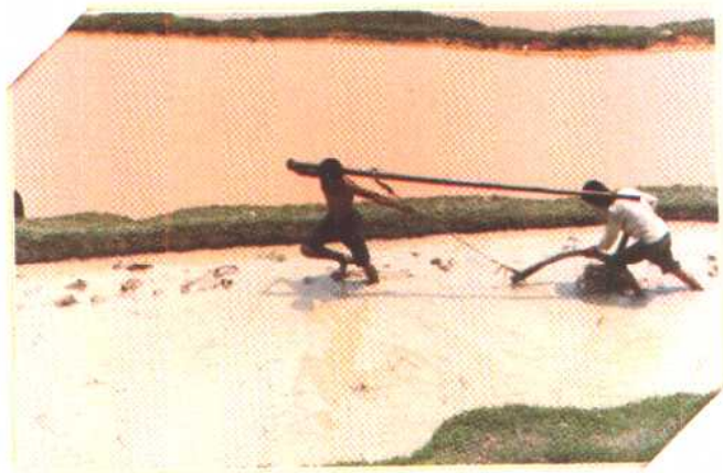
◀ 原始农耕技术