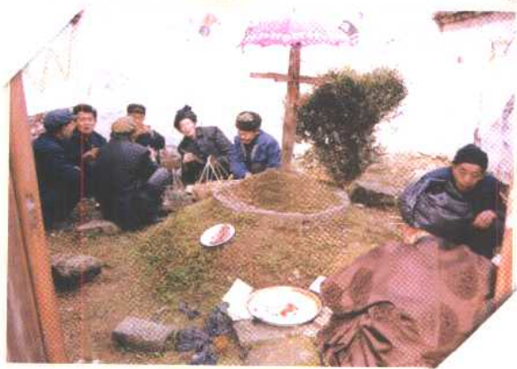
◀ 贵州从江干团寨萨堂祭萨