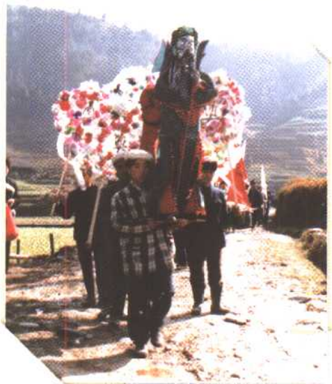
◀ 丧葬习俗：关公开路