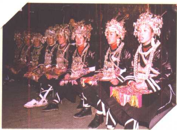
◀行歌坐月中两寨对大歌