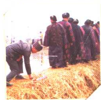
◀◀ 耕 耩 礼