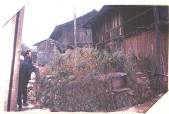
▶ 湖南通道芙蓉村内萨坛