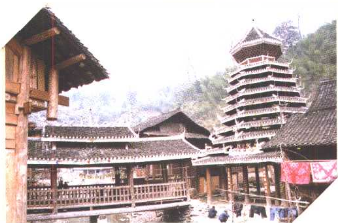
◀ 雕龙画凤的花桥和鼓楼