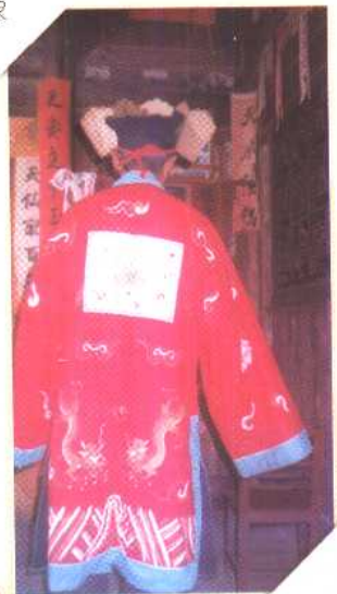
◀ ▶ 法师的服饰道具