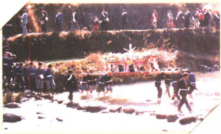
◀ 棺罩上的白仙鹤 （乌图腾）