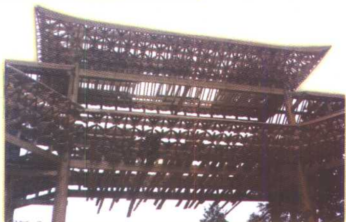
▶ 侗寨门楼上的鸟崇拜