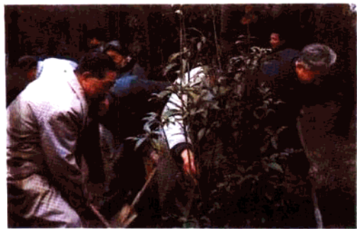
省政协副主席罗运来（左一）与部分在宁委员参加植树节种树。