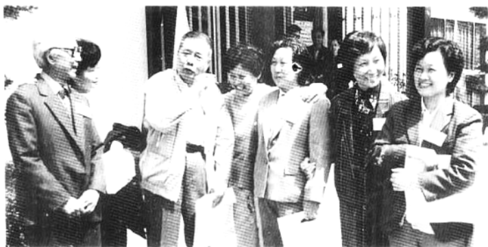
省政协会议间隙，委员们在一起畅谈。