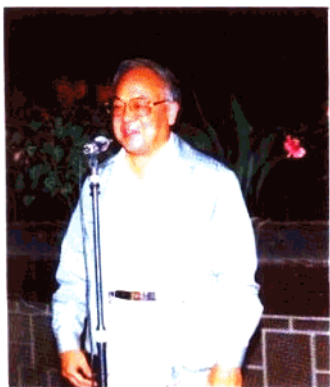
省政协主席孙颢在中国人民政治协商会议成立40周年纪念大会上讲话。