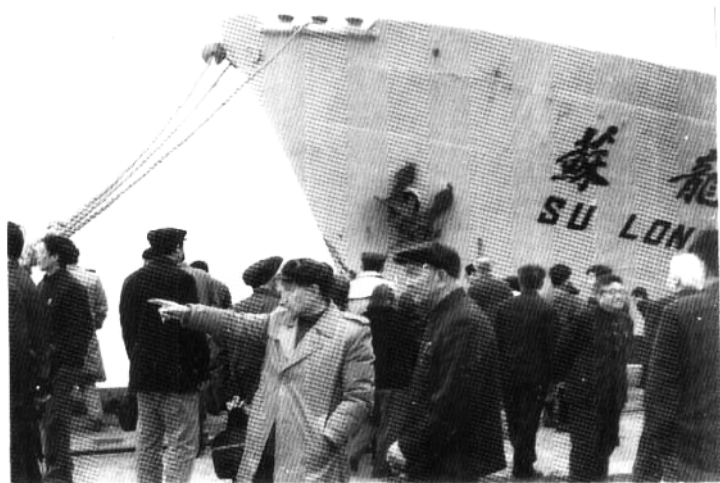
在宁的省政协委员视察南京港，对港口的建设提出设想和建议。