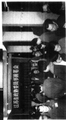
江蘇省政協委 員書畫會一隅