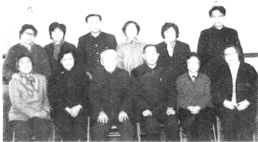
1989年3月8日，省政协负责同志与参加省政协六届五次常委会的部分女委员合影，祝她们节日快乐。