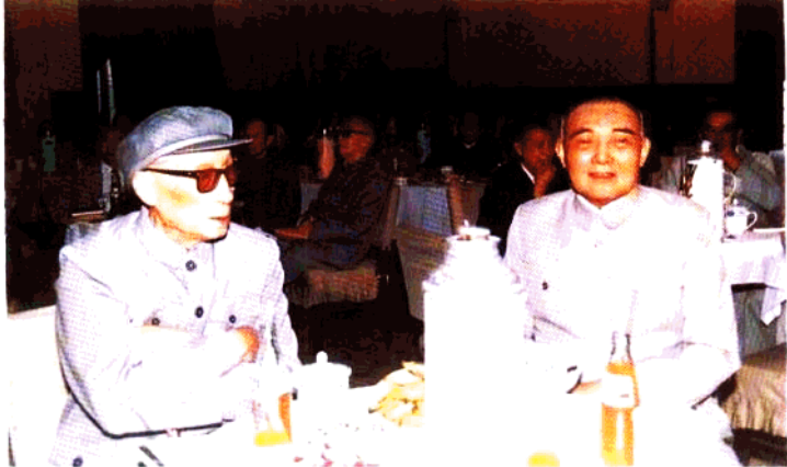
江渭清（右）、管文蔚与部分老同志在中国人民政治协商会议成立40周年纪念大会上。