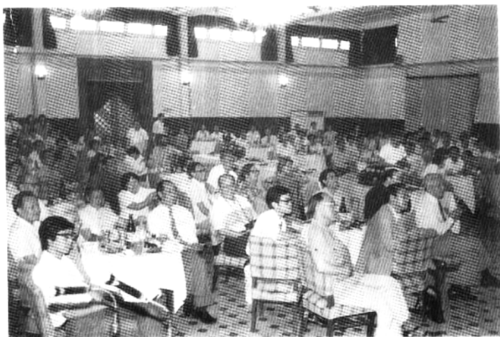
省政协委员与出席“维护世界和平会议”的23个国家的友好人士座谈。