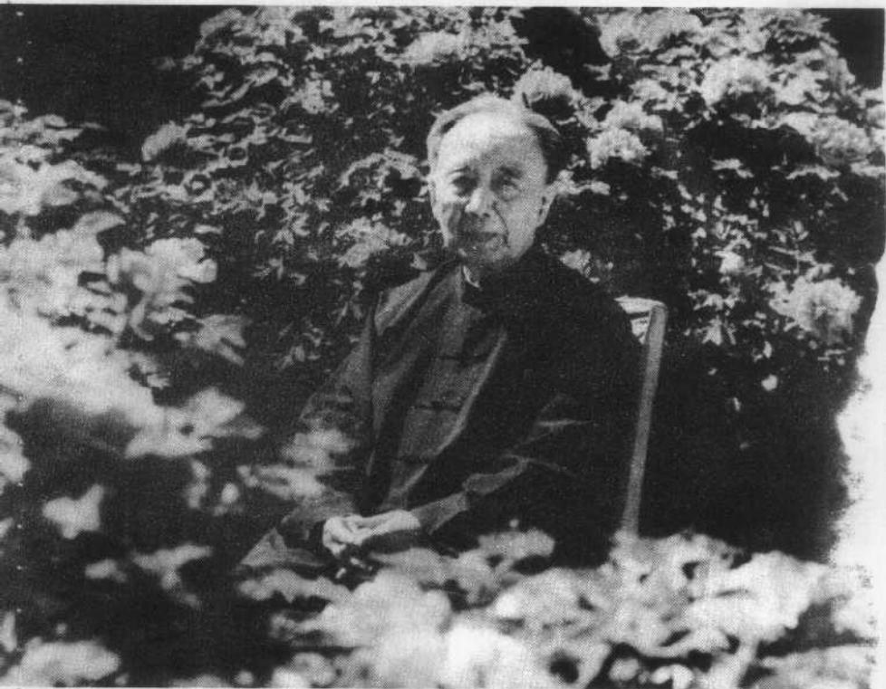
卓越的无产阶级文化战士郭沫若同志