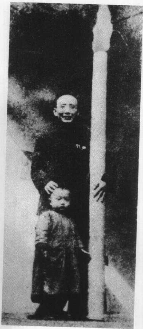
一九四一年十一月五十岁时摄，大笔是生日礼物