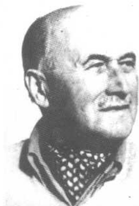
欧洲第一公民让·莫内