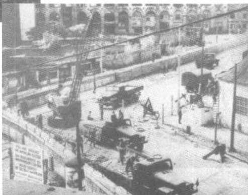
民主德国政府在东西柏林分界线上修 筑柏林墙