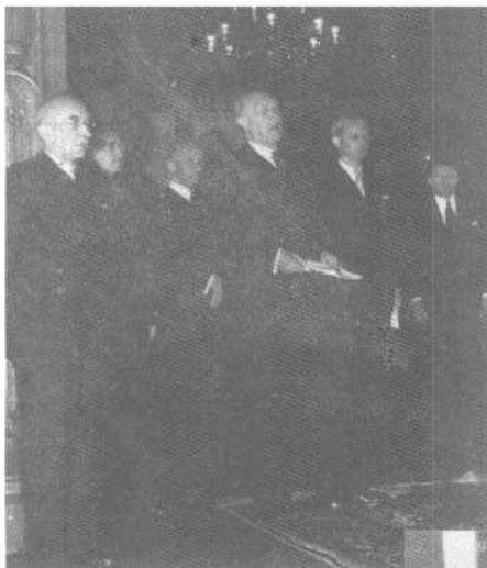
1949年9月21日阿登纳就任 联邦总理，率领部分阁员晋 见西方三国高级专员