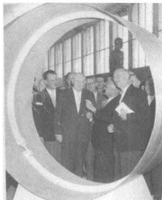
路·艾哈德教授（左侧拿雪茄烟斗者），经济奇迹之父，宣布工业博览会开幕