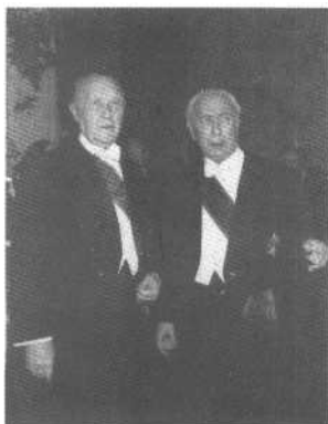
1956年初联邦总理阿登纳在波茨坦招待会上