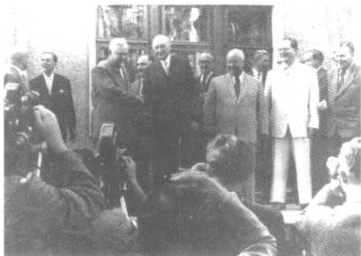
1955年9月阿登纳访问莫斯科，与苏联部长主席布尔加宁握手，右立者为苏共总书记赫鲁晓夫