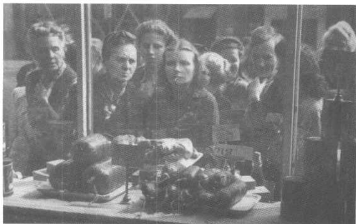
币制改革后橱窗里立即摆满了货物