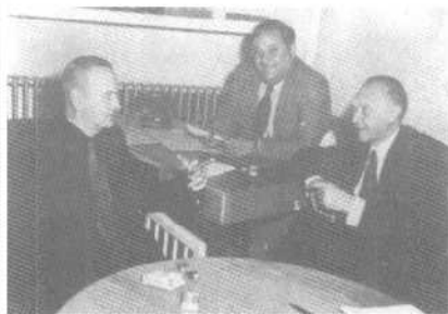
1949年9月阿登纳会见社会民主 党主席库特·舒马赫，后坐者 为社会民主党另一领导人卡洛 ·施密德