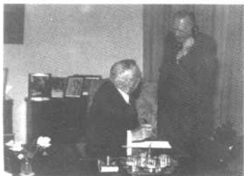
阿登纳和美国国务卿杜 勒斯(1954年9月16日)