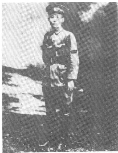
1924年12月在黄埔军官学校时摄。时任第三期入伍生总队附代理总队长。