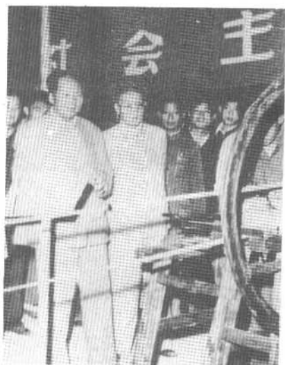
1958年9月，毛泽东视察大江南北各省，张治中被邀偕行。图为在参观安徽农县改良展览会上所摄。