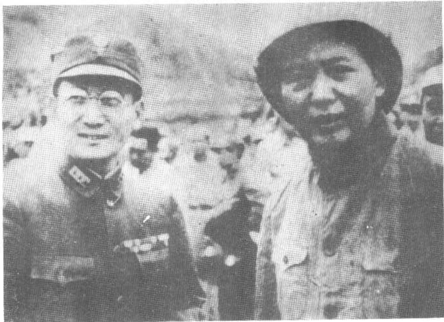
1945年8月27日，张治中作为蒋介石代表径延安迎接毛泽东到重庆谈判，图为毛、张在延安机场即将登机前合影。