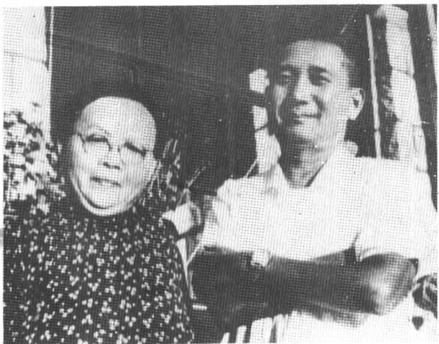
60年代初，张治中夫妇在北戴河疗养，摄于中海滩21号（原陈毅元帅的寓所，后让给张治中）。