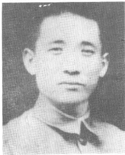
1932年一·二八上海抗日战争中摄。