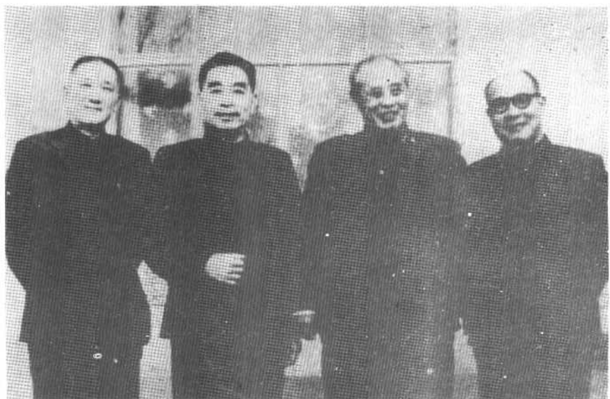
60年代初，周总理与张治中、傅作义、屈武欢叙后所摄。