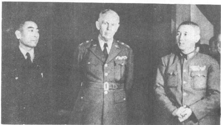
1946年2月，军事三人小组就整军方案达成协议，签字后在会场摄。