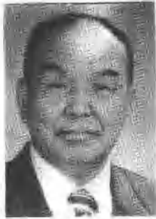
莫德尔图(达斡尔) 特邀顾问