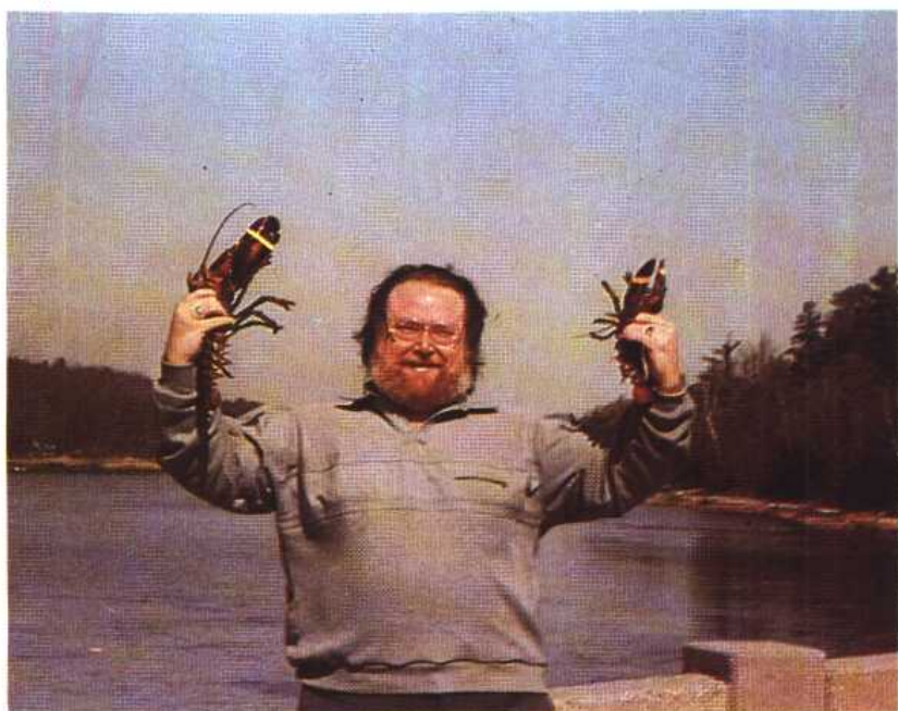
作者举着两只新英格兰产的龙虾