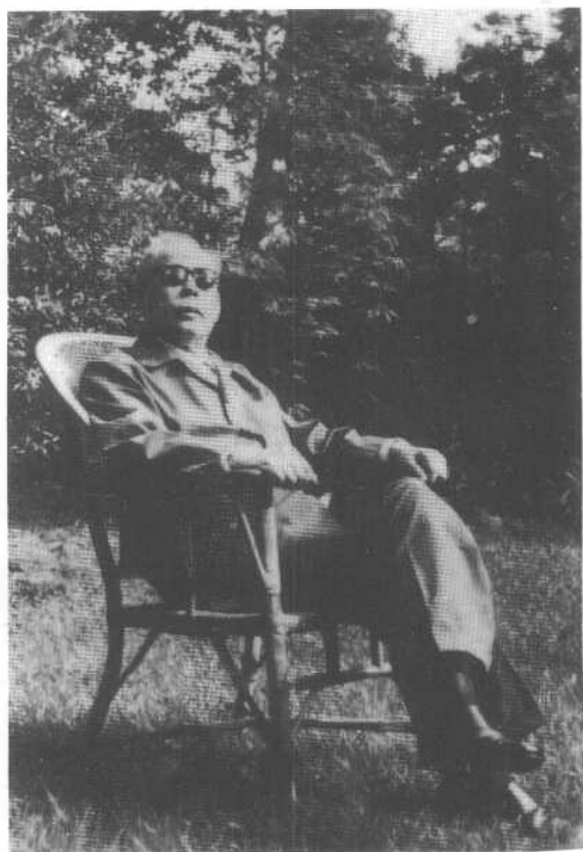
一九八〇年在上海寓所花园中