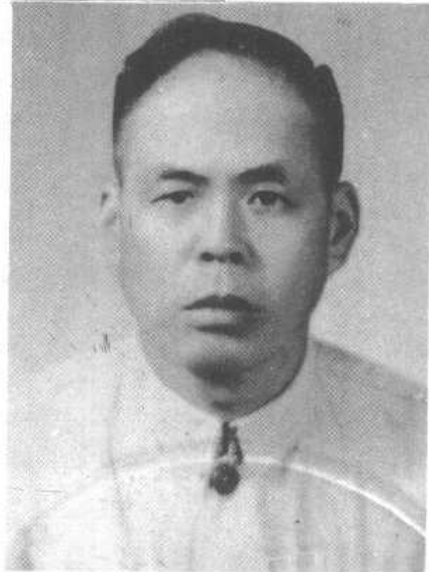
一九五一年任复旦大学教务长时之影