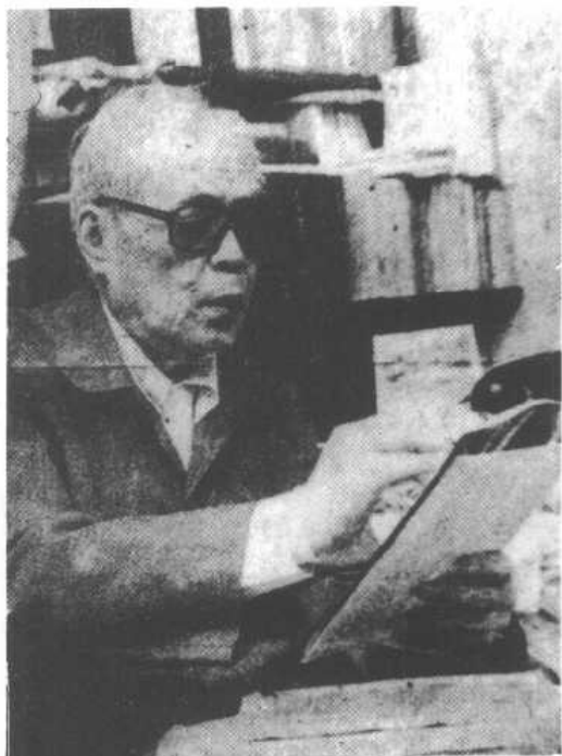
一九八三年任全国人大副委员长时之影