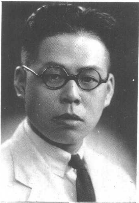
一九三九年写《中国通史》一书时之影