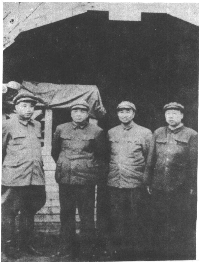
→ 陈赓与金日成、彭德怀、甘泗淇在中国人民志愿军驻地。 (1952年)