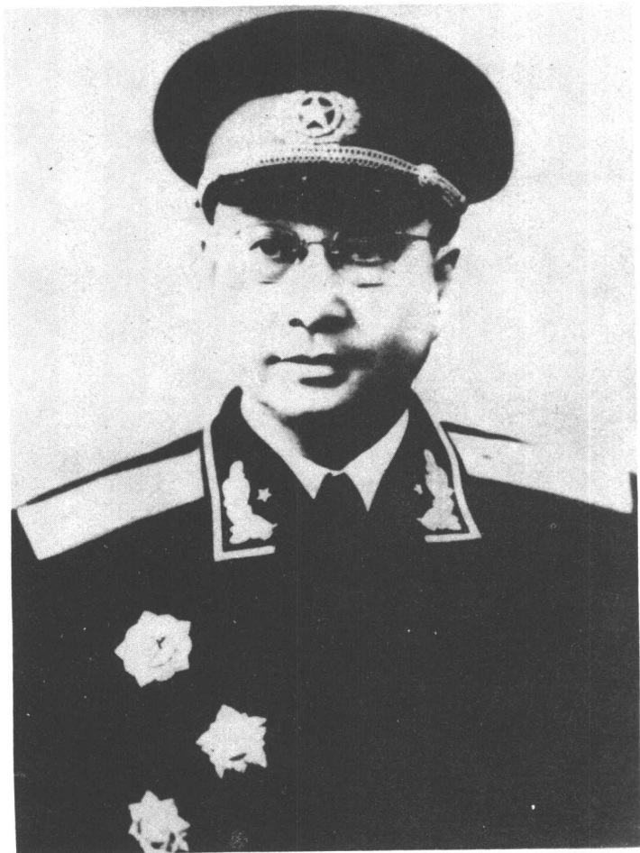
陈 赓 大 将