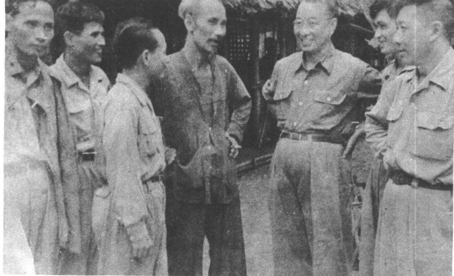
↑ 陈赓和胡志明在越北前线。 右一为罗贵波、 右五为武元甲、 右七为范文同。 (1950年夏)