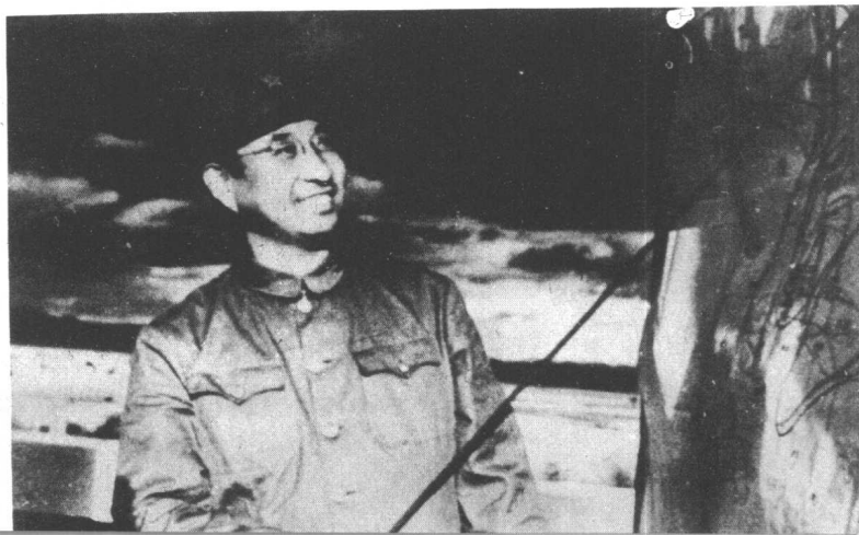
→ 陈赓在广 州前线 （1949年10月）