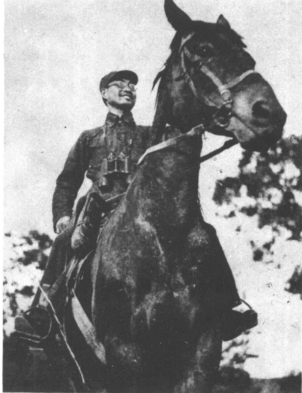
← 1938年陈赓在 太行前线

↓ 在陕北靖边小 河村，出席中央前 委扩大会议。左起： 彭德怀、贺龙、陈 赓、王震。