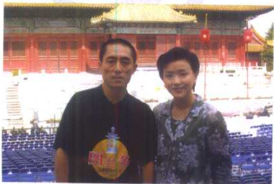
杨澜采访著名电影 导演张艺谋