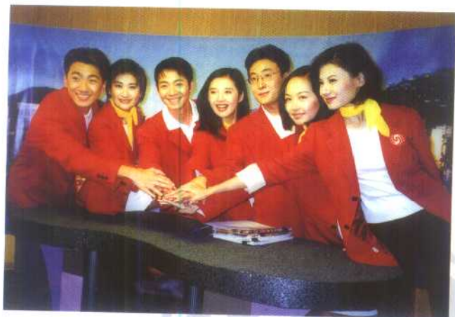
香港回归之际，凤凰卫视连续60小时直播报道。图为参与报道的主持人。