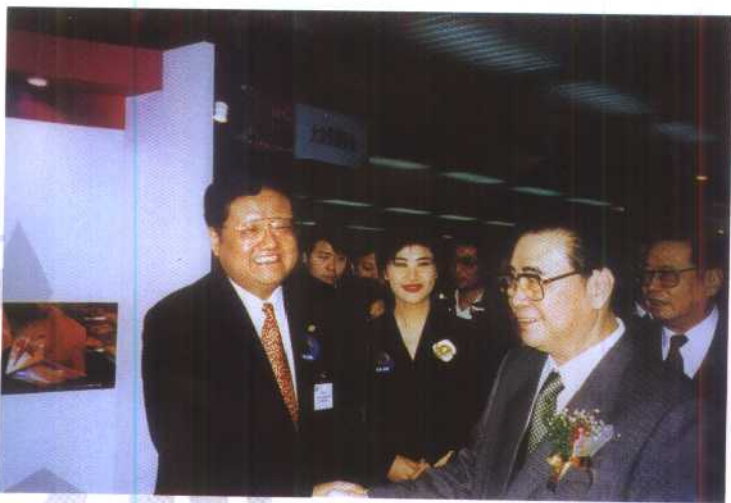
全国人大常委会委员长李鹏 1997 年 3 月 28 日接见刘长乐。