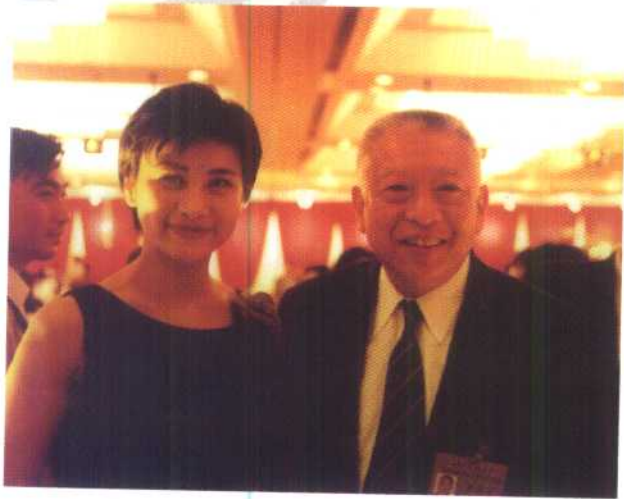
香港特别行政区行政长官董建华与吴小莉在一起