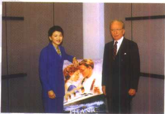
杨澜与国际传媒大亨 默多克在一起