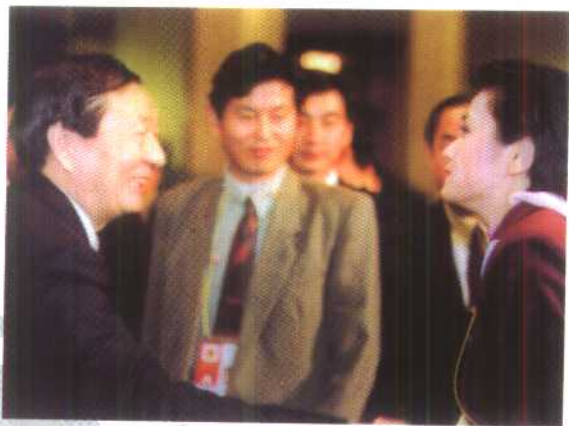
国务院总理朱镕基在九届人大一次会议记者招待会上与凤凰卫视记者吴小莉亲切握手