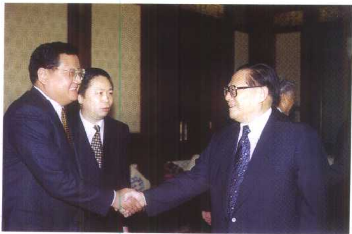
国家主席江泽民 1998 年 12 月 10 日接见凤凰卫视有限公司董事局主席、行政总裁刘长乐。