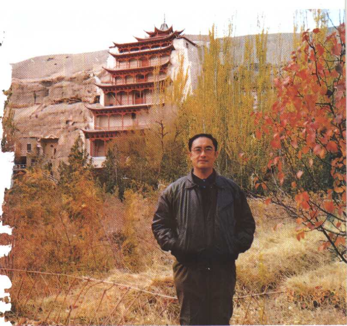
版图1 作者在敦煌考察中国古代性文化(1991年10月)