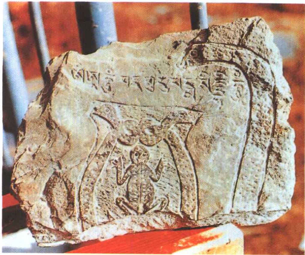
版图 6 蛙与蛇(西藏石雕 性崇拜象征)