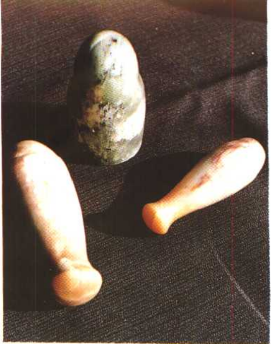
版图 5 玉男根与石男根