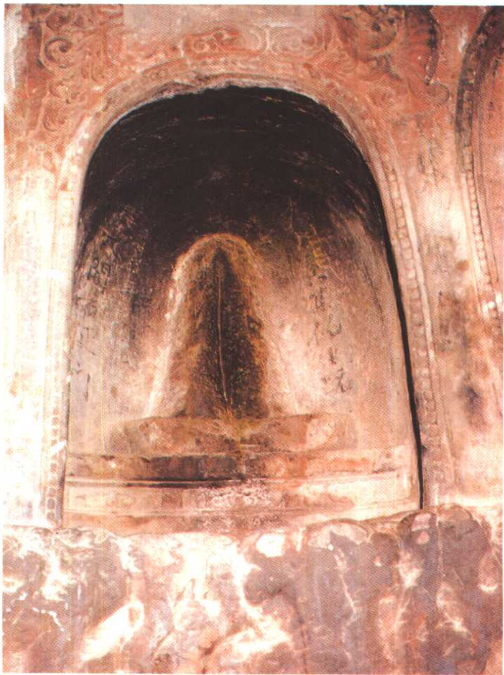
版图 4 阿央白(女阴崇拜物)四川剑川石钟山石窟