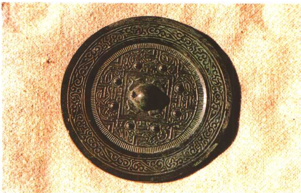
版图 5 有生殖崇拜意义的东汉八乳镜