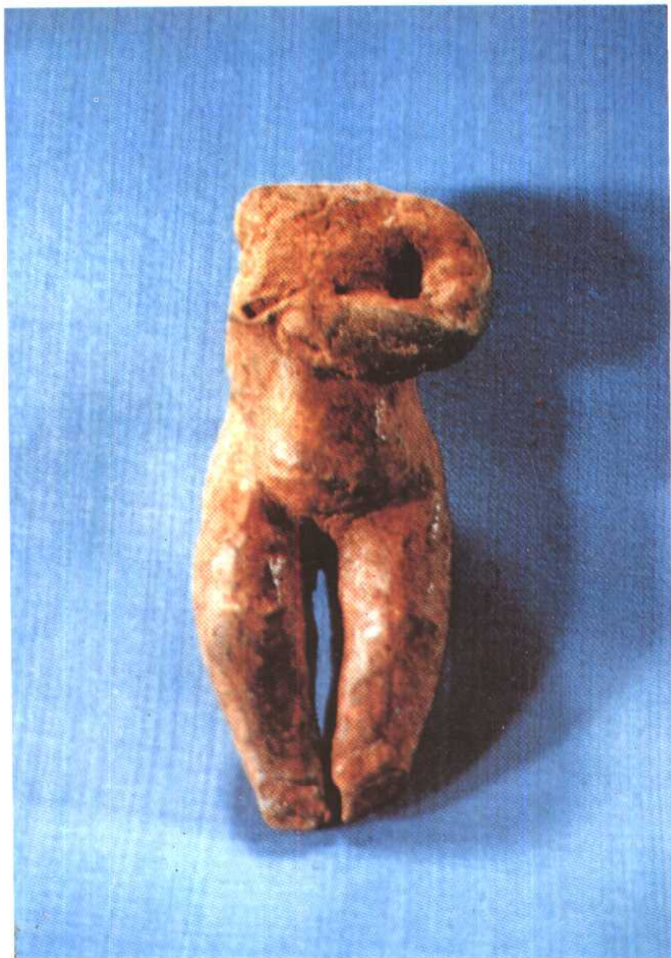
版图 3 红山文化的孕妇裸像