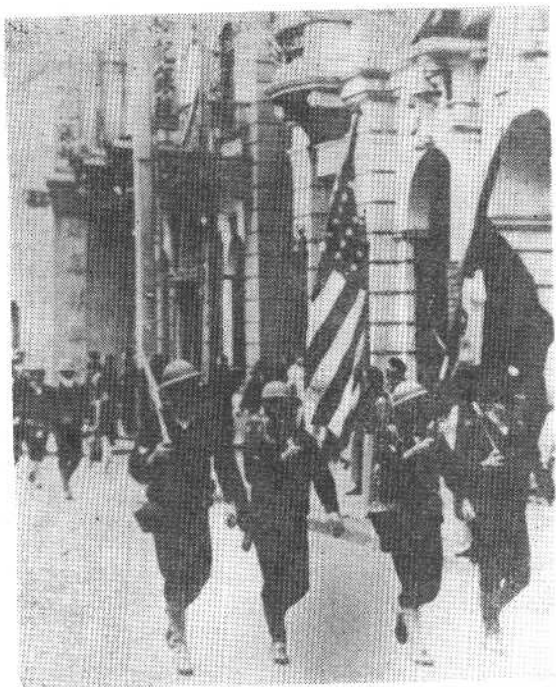
美国海军在上海公共租界布防(1927)