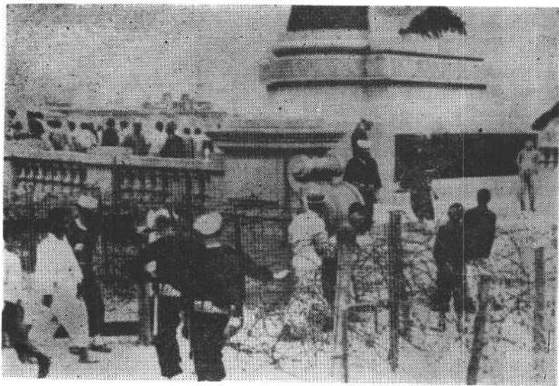
在上海公共租界与法租界之间的美军检查哨(1927)