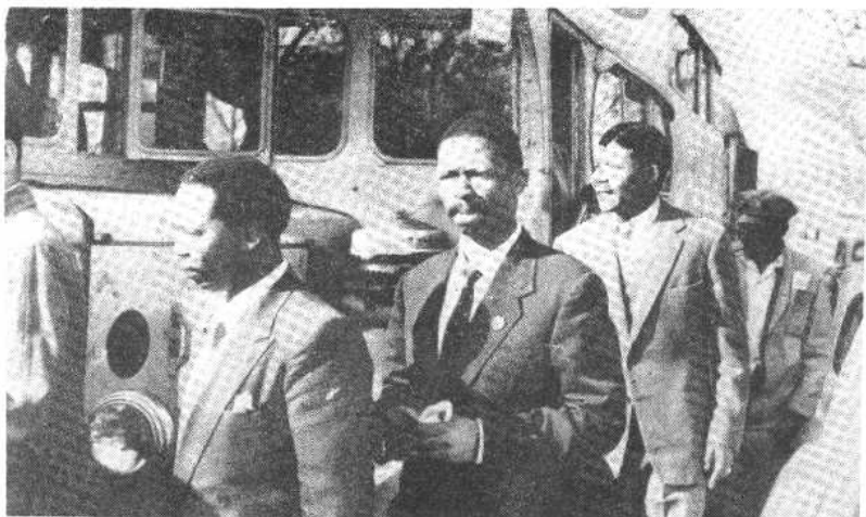
图四、图为1956年12月曼德拉与其他“判国罪审判”中的被告抵达约翰内斯堡法院时的情景，图中右二为曼德拉。