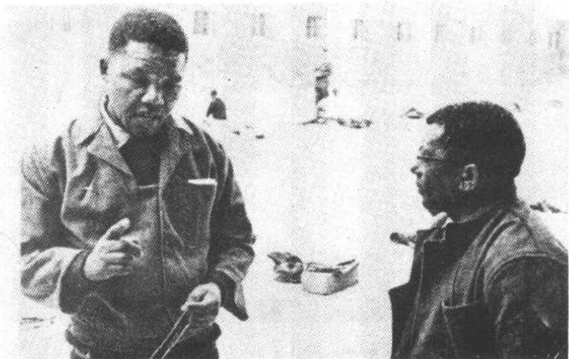
图九、图为1966年曼德拉与西苏鲁在罗本岛监狱内的院子里。