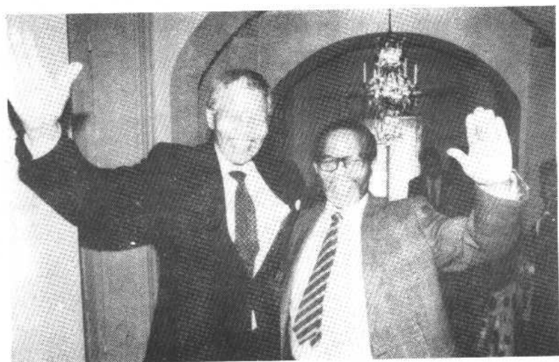
图十二、图为 1990 年 3 月 12 日，在阔别 28 年之后，获释后的曼德拉与老战友坦博重聚在瑞典首都斯德哥尔摩。