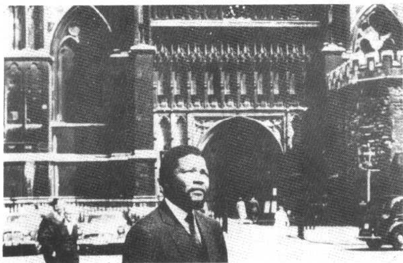
图八、图为1962年曼德拉在英国伦敦威斯敏斯特大教堂外。