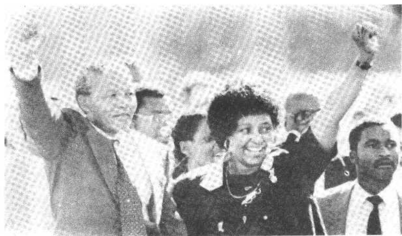
图十一、图为 1990 年 2 月 11 日曼德拉获释之后在温妮的陪同下步出维克托·韦斯特监狱大门。