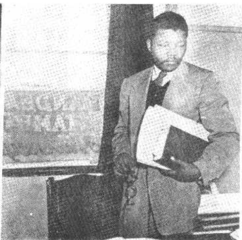
图二、图为曼德拉在他与坦博共同于 1952年开办的律师事务所内。