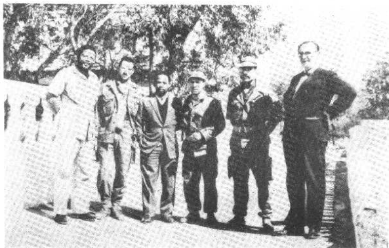
图七、图为1962年曼德拉秘密出国后在阿尔及利亚的一个军事司令部内，左一为曼德拉。