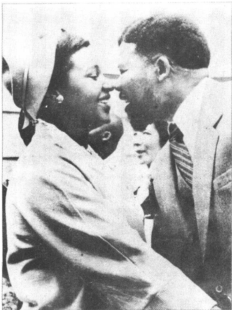
图六、图为 1959 年的曼德拉与温妮在一起。