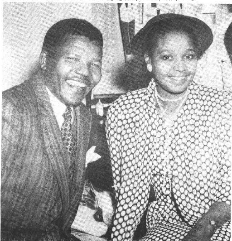
图五、图为1958年6月14日曼德拉与温妮在婚礼上。