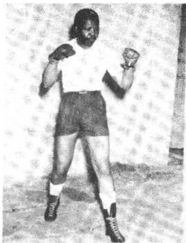
图一、图为年轻时的曼德拉正在 在进行拳击训练。