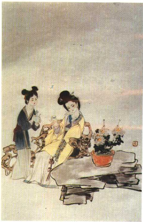
《聊斋志异·黄英》插图 刘旦宅作