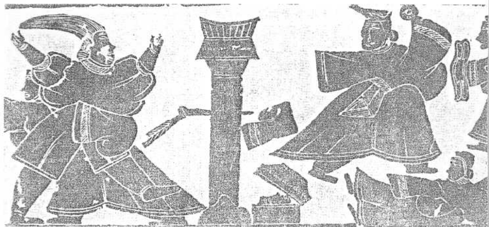
《荆轲刺秦王》汉画像石