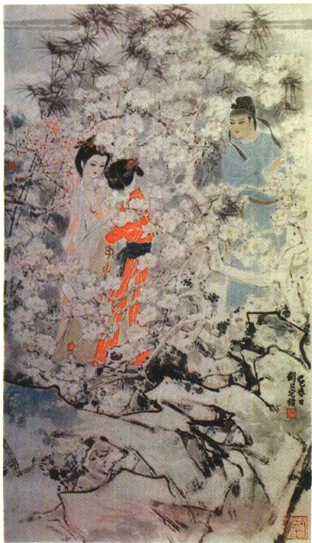
《聊斋志异·娇娜》插图 刘旦宅作