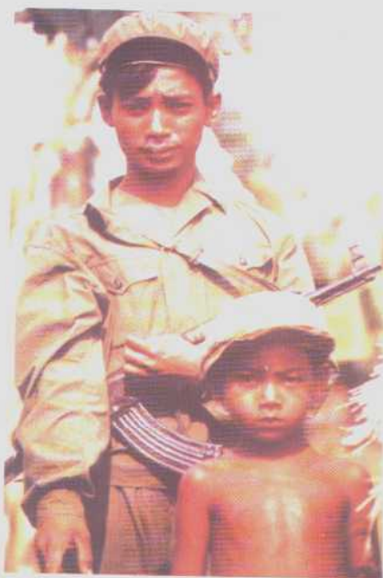
红色高棉战士和村里一小男孩。